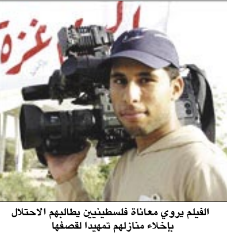
الفيلم يروي معاناة فلسطينيين يطالبهم بالاحتلال بإخلاء منازلهم تمهيداً لقصفها

أمله أن يحالف الفوز الفيلم الذي شارك في إعداده نخبة الشباب الفلسطيني الطموح والمبدع.