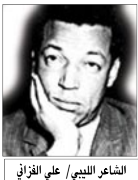
الشاعر الليبي / علي الغزالي

ولدت جويس منصور في بريطانيا من عائلة مصرية سنة ١٩٢٨ انضمت إلى الحركة السورية ما إن رُحِبَ السوريون بعلمها الأول صرخات سنة ١٩٥٣، ومدت بقيت جويس التي أنجبت من سمير منصور ولدين، وقيّة للمشروع السوريالي كتابة وسلوكاً حتى وافاها الأجل في باريس في ٢٨ آب (أغسطس) ١٩٨٦، اثر مرض السرطان. في لغتها، ينضج جسد المرأة كأنثاً بشريا يتمتع بكل حقوقه حتى الاستفزازية منها في اجترار الانتشاء وتنفس هواء اللذة الطلق، ملاكاً انقطع بكل مخيلته إلى رفض التاريخ المعطى للجسد، وهاهو الشعر يتجلى بين شراريف الكلام صوراً شرسة ترتقي نزوة الرهزة الصادمة للأخلاق السائدة. خصت جويس منصور، ذات مرة، إنجازها الشعرية الضخم بالعبارة التالية: "كل هذا يجعل مني سيدة غريبة" ربما لكن لهذه "السيدة الغربية"، النبتة المسكية، بل الطفلة القادمة من فضاءات الكناية الشرقية على حد كلمة بروتون، شخصيات كافية من التجربة تجعلها متمردة دون ادعاء التمرد، خلافة دون أي استعراء ثقافي، حتى لو بدت هذه القصيدة أو تلك في عين المحروم من ملامسة الحياة، خلاعية. جاء إسهام جويس دفعةً ودفقات جديدة في دماء الحركة السورية بعد الحرب العالمية الثانية وزخماً أغني إنجازاتها الشعرية. وفي ربيع ١٩٦٨ نأت جويس بنفسها نهائياً عن الجماعة السورية، بعد أن بدأت تدب فيها انشقاقات وصراعات هامشية أوصلتها لياب مسدود ونزاعات حول قيادتها، لكنها بقيت على صلة شخصية بغالبية الأعضاء الذين رفضوا إعلان جون شوستر حل الحركة كتخليص في ١٩٦٩، في خرق سافر لمبادئ العمل الجماعي، ودون