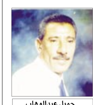
جميل عبد الوهاب

من اطلق العنان للعبارة) ليرموا بهم في هجير الصحراء .. التالية لم يستهجنوا خطر الموت الذي كان يدهمهم .. خسروا (18) نقطة على ارضهم وبين يديهم .. وعند البحث عن النقطة (الواحدة) فقط ، لكي يصعدوا اعطوا الفرصة (للجهاذة) لكي ينهبوا هذه النقطة وبالتالي اسقاطهم وتهيبهم .. التالية لم يدركوا (ميكرا) ان النوم فعل ارادي ، إذ ليس بإمكان احد ان يجبرك على ان تنام .. والتالية ناموا طويلاً وعند الصحوه المتأخرة جدا اعطوا المساحة الشاسعة (للجهاذة) لافتراسهم .. التالية عودنا على الظهور بشكل قوي وبكبرياء وعزة نفس .. عودنا على الظهور الاشبه بشجرة سنديان .. تقف صامدة في وجه الرياح والاعاصير .. ولكنهم سمحوا (للجهاذة) والذين هم ليسوا اكثر من زهور ، والزهور عمرها قصير .. سمحوا (للجهاذة) (الزهور) ان تناطح شجرة السنديان فترقعها .. وان كان ليس من المنطق في شيء ان تناطح زهرة شجرة سنديان بل وتطبخ بها .. ولكن التالية .. والتالية وحدهم وقفوا ضد هذا المنطق .. ليس في المباراة الفاصلة .. ولكن قبلها بكثير عندما كانت تتهاوى (القطا) والتالية يضحكون !! .