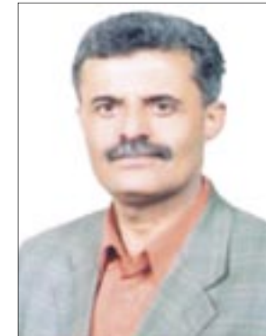
مدير المنتخب الوطني لكرة السلة

قبل مغادرته إلى إيران وخلال الموسم تشاهد الكثير من محبي التلال والشعلة وتوجسوا من مفاجاته ، وقد قرص القلق عليهم ليضعوا أيديهم على قلوبهم من بدء أول مباراة حتى نهاية الدوري ، كأنهم قرأوا وقائعهم من خلال أوضاع فرقيهما واستعداد لاعبيهما من كل النواحي ، وبالفعل حصل ما حصل ، وما توقعوه قد حدث ، الشعلة أنقذ نفسه في آخر اللحظات والتلال ودع دوري الأضواء ليحقق بفريق ( دوري الناشئين ) .. ليكون هذا الموسم أسوأ موسم كروي شهدته محافظة عدن وأبنائها .. أنه موسم الحزن والحسرة ودموع الندم . أسأ من ناحيتنا توقعنا أي نتيجة قبل وقائع وأحداث المباراة المصرية ، سواء زهيمه التلال أو فوزه على وحدة صنعاء ، إلا أن دعواتنا وصلتنا لم تنقطع لصحة التلال .. هذا الفريق الذي شققت وأعجبت به منذ متابعتنا لمبارياته أيام لاعبي الزمن الجميل من