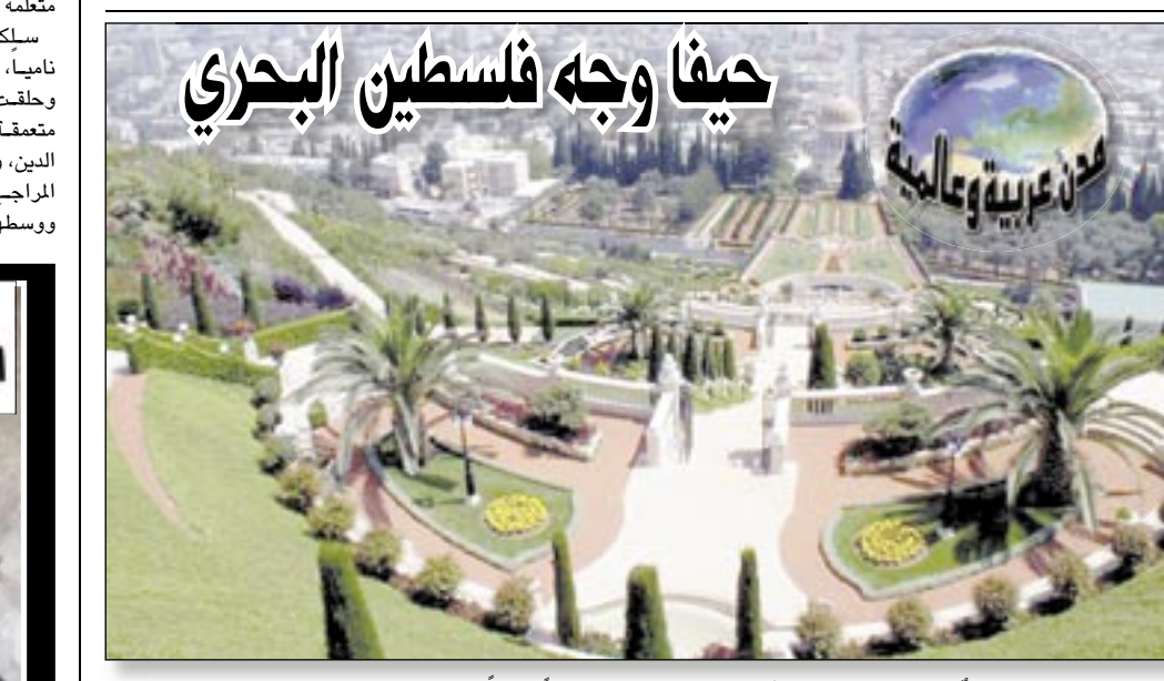
حيفا وجه فلسطين البحري

والأنسجة. وحيفا كانت مركزاً نشيطاً للحركة الثقافية والسياسية والمُالية، وعلى أرضها قامت المنظمة الثورية التي أسسها الشيخ عن الدين القسام. وفي حيفا صدر خلال فترة ١٩٤٦ و ١٩٨٠ حوالي ١٩ صحيفة ومجلة، وانتشرت فيها المطابع والجمعيات والأندية والفِرَق المسرحية. في أواخر عهد الإنتداب كان في حيفا ٢٠ مدرسة مِمَّا بين إسلامية ومسيحية