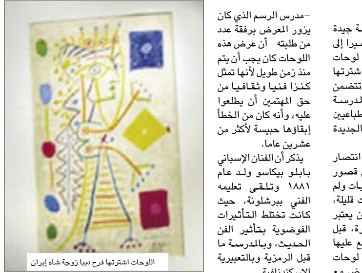
اللوحات اشترتها فرح نيا زوجة شاه إيران

اللوحة والأعمال الفنية من أشهرها لوحة "الجورنيكا" التي تصور مآسي الحرب الأهلية الإسبانية.