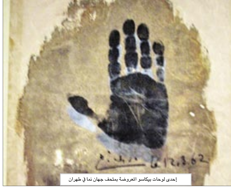
إحدى لوحات بيكاسو المعروضة بمتحف جهان نما في طهران