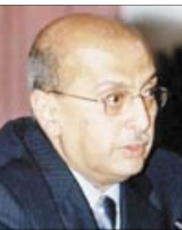
التتمة ص 2

القريب : مبادرة اليمن لاستئناف الحوار بين فتح وحماس تصب في تحقيق الوفاق والأهداف الوطنية للفلسطينيين