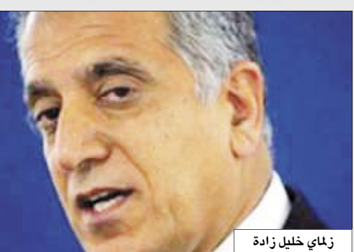
زماي خليل زادة

الأمم المتحدة 14/أكتوبر / باتريك وستيب ، صوت مجلس الأمن الدولي أمس الجمعة لصالح قرار يمنح الأمم المتحدة دوراً سياسياً موسعاً في العراق لتعزيز المصالحة بين طوائفه المتناحرة والحوار مع دول الجوار. ووافق أعضاء المجلس الخمسة عشر بالإجماع على قرار أعدته الولايات المتحدة وبريطانيا يزيد مسؤوليات بعثة الأمم المتحدة لمساعدة العراق (يونامي) التي انتهت تفويضها أمس الجمعة. ويطلب التفويض الجديد البعثة بتقديم "المشورة والدعم والمساعدة" للعراقيين فيما يتعلق "بإدفع حوراهم السياسي والشامل والمصالحة الوطنية قدماً" ومراجعة دستورهم وترسيم حدود المناطق وتنظيم إحصاء رسمي للسكان. وستعمل البعثة أيضاً على دعم المبادرات بين العراق وجيرانه بخصوص أمن الحدود والطاقة واللاجئين، والمساعدة في عودة الملايين الذين فروا من العنف فضلاً عن تنسيق جهود إعادة الإعمار والمعونة والمساعدة في دعم الإصلاح الاقتصادي. ومن المتوقع أن يستلم الدور الموسع للمنظمة الدولية زيادة عدد موظفيها ببغداد الذين يبلغ عددهم حالياً نحو 50 قيمينون في مجمع المنطقة الخضراء المحسن الذي يضم مقار حكومية ودبلوماسية. وحتى الآن ينصب الاهتمام الرئيسي للموظفين الدوليين على المساعدة في إجراء الانتخابات ومراقبة حقوق الإنسان.