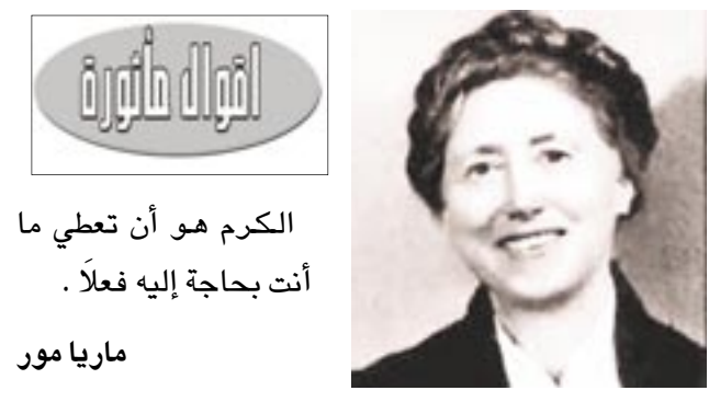
الكرم هو أن تعطي ما أنت بحاجة إليه فعلاً.