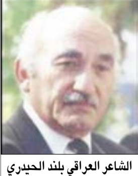
الشاعر العراقي بلند الحيدري

بدأ بنشر عدد من القصص القصيرة في صحيفة (سانت بطرس بيرج) وبعد تخرجه عمل في مهنة الطب عمل طبيباً ممارساً لعدة سنوات، ولذلك هناك عدد كبير من الأطباء بين أبطال قصصه كاستروف وديموف وإيونيتش، أبطال سلسلة القصص (جراحة)، (السرير رقم ٦)، وغيرها الكثير. ولم يتحول تشيخوف إلى كاتب مقفرغ إلا في سنة ١٨٨٦ ليحصل بعدها بسنتين على جائزة بوشكين في الأدب. تزوج العمة الروسية أولغا ليوناروفنا كخبر في عام ١٩٠١، وبعد اشتداد مرضه نصحه أصدقائه بالسفر للعلاج في ألمانيا في العام ١٩٠٤ حيث توفي أنطون بأقل فيتش تشيخوف عن عمر يناهز الرابعة والأربعين. تم نقل جثمان تشيخوف إلى روسيا ليدفن في مقبرة (نوفوديفيتشي) في موسكو، اكتسب تشيخوف موهبته في الكتابة من أمه إيجينييا تشيخوف التي كانت تروي الكثير من القصص رغم كونها لم تحصل على قدر كاف من التعليم إلا أنها كانت تميل إلى رواية القصة كما يقول تشيخوف.