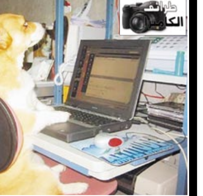
مقابل المسرح القومي.