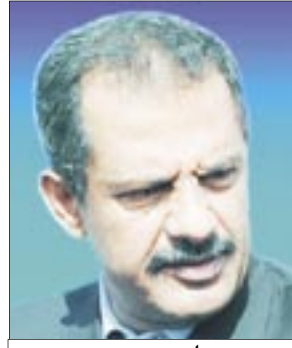
د. علي محمد مجور

صنعاء / سبأ، انتقد الدكتور علي محمد مجور، رئيس مجلس الوزراء موقف بعض قيادات المشترك تجاه أعمال الشعب والفوضى التي قامت بها بعض العناصر غير السؤولة والخارجة عن القانون، الخميس الماضي بمحافظه عدن.