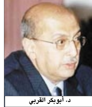
د. أبو بكر القربي

صنعاء / متابعات، أكد وزير الخارجية الدكتور أبو بكر القربي أن ملف تمرر الحوثي في صنعاء سيفلق قريبا مشيرًا إلى قضية المبادأة القطرية لإنهاء التمرد في صنعاء، وقال: نحاول إعادة التمردين إلى صوابهم حتى يكونوا مواطنين يساهمون في التنمية بدلا من التدمير، وتوجد مجموعات عادت بالفعل إلى صوابها وسوف يغلق هذا الملف قريبا.