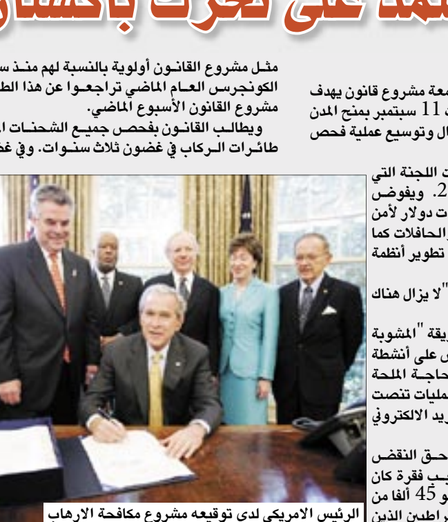
الرئيس الامريكي لدى توقيع مشروع مكافحة الارهاب

مثل مشروع القانون أولوية بالنسبة لهم منذ سيطروا على الكونجرس العام الماضي تراجعوا عن هذا الطلب وأقروا مشروع القانون الأسبوع الماضي. ويطالب القانون بفحص جميع الشحنات المنقولة على طائرات الركاب في غضون ثلاث سنوات. وفي غضون خمس سنوات يتعين تفتيش كل الشحنات المتجهة إلى الولايات المتحدة قبل تحميلها على السفن. ويطالب الديمقراطيون منذ سنوات بفحص الشحنات قائلين إن هذا سيسمح للإرهابيين من تهريب متفجرات إلى داخل الولايات المتحدة. غير أن المعارضين قالوا إن تفتيش الشحنات بنسبة مئة بالمائة مكلف وغير ضروري. على صعيد متصل قال مسؤولون وخبراء إنه رغم الدعوات المطالبة ببحرك أمريكي ضد تنظيم القاعدة في باكستان فإن إدارة الرئيس الأمريكي جورج بوش ما زالت تعتمد على القوات الباكستانية لنشل عمليات الجماعة المتشددة من خلال سلسلة من الغارات تساندها الولايات المتحدة. وقال مسؤولون أمريكيون إن القوات الباكستانية المزودة بطائرات هليكوبتر أمريكية ونظارات للرؤية الليلية وعتاد متطور آخر يرجح ألا تتمكن من القضاء على الملاذ الآمن للجماعة المتشددة في إقليم وزيرستان الشمالي النائي. لكن مسؤولين يعتقدون أنها تستطيع القضاء على بعض زعماء تنظيم القاعدة وتعطيل المنشآت الرئيسية داخل ما يقول البعض إنها شبكة جماعات صغيرة للمتشددين تنتشر في أنحاء المنطقة الجبلية الوعرة.