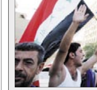
بعث الدكتور ابوبكر القربي وزير الخارجية مع نظيره المصري احمد ابو الغيط في القاهرة أمس جدول أعمال اجتماع وزراء خارجية الدول العربية المقرر أن يبدأ أعماله اليوم الاثنين .

بعد أن تجاهل العراقيون أوامر السلطات الأمنية والزعما الدينيين بعدم إطلاق النار في الهواء. وقرضت السلطات حظر تجول على حركة السيارات وقرعت قوات الأمن حالة التأهب بعد مقتل 50 شخصا في هجمات انتحارية ضد مشجعين بعد فوز العراق في مباراة الدور قبل النهائي يوم الأربعاء الماضي. وانترى الفريق شاربات سوداء حدادا على القتلى. وقالت الشرطة إنه لم ترد أية بلاغات عن وقوع أعمال عنف كبيرة ضد مشجعي كرة القدم بعد المباراة النهائية رغم مقتل ستة أشخاص عندما ضربت قذائف مورت منزل في بلد الواقعة على بعد 80 كيلومترا شمالي بغداد. التتمة ص 2