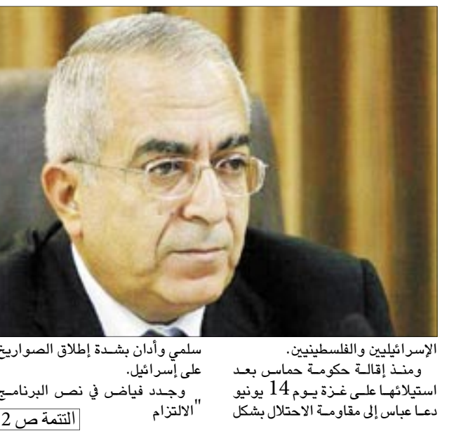
التتمة ص 2

دون حماس التي فازت في الانتخابات التشريعية قبل 18 شهرا. وأكد مسؤولون فلسطينيون يوم الجمعة أن البرنامج الجديد أسقط عبارة "المقاومة المسلحة" ضد الاحتلال الإسرائيلي. ورفضت حماس الطالب الدولية بالاعتراف بإسرائيل ونبذ العنف لأجل تحديثه باسم رئيس الوزراء الإسرائيلي إيهود أولمرت رحبت بالصياغة الجديدة. وعرض فياض البرنامج على عباس يوم الخميس. وفيما هو خبير اقتصادي تلقى تعليمه في الولايات المتحدة ويهتم بتطبيق إصلاحات الفساد وتطبيق إصلاحات. ويتزامن تعديل صياغة برنامج الحكومتين السابقتين اللتين قادتهما حماس مع تزايد النشاط الدبلوماسي بهدف استئناف محادثات السلام المتوقفة منذ فترة طويلة بين