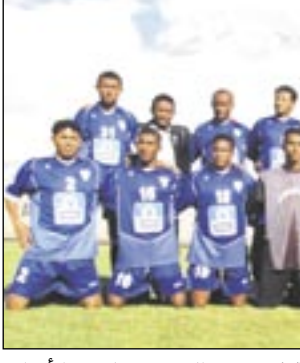
مستواه بعد أن كان أحد أبرز أندية البطولة في مجموع التجميعين وله من الأهداف ٢٦ وعليه ١٧٤ وله صافي أهداف ٣٢ هدفا .

القادم برئاسة وزير التربية والتعليم الدكتور عبد السلام الجوي.. منوها بالخطوات التي تم قطعها، والتعاون المموس من قبل وزارة الشباب والرياضة، واتحاد كرة القدم في الجوانب الفنية والمرتبطة بالمنشآت وملعب التدريب.