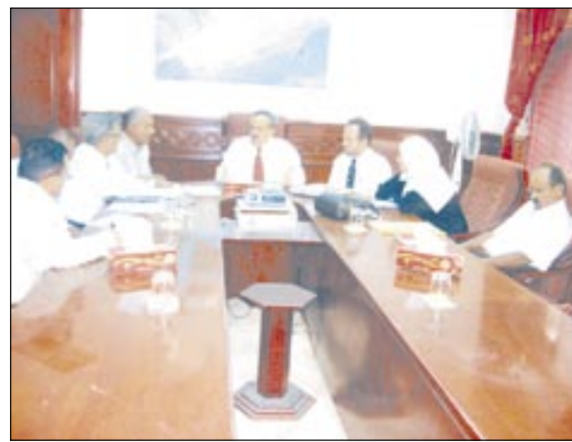
الثانوية العامة واتخذت إزاءها المعالجات اللازمة.

دعت كل المواطنين الشرفاء في محافظة عدن الى الاصطفااف صفا واحداً مع الأجهزة الامنية لكشف المخططات الدنيئة لاي اعمال ارهابية تستهدف النيل من الامن والامان واحداث الخسائر لاقتصادنا الوطني او المساس بسمة ووطننا اليمني.