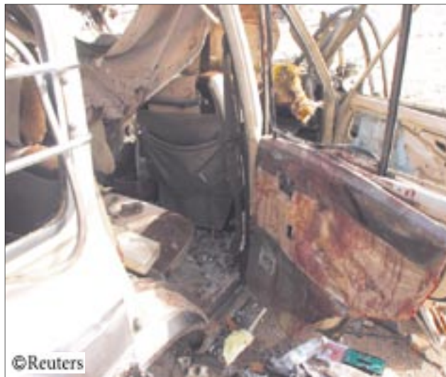
المتطرفين الحاقدين على بلد الإيمان والأمان وتلطبخ سمعتنا بشيء ليس من أعمالنا أو من ماضيها وتاريخنا المشرف منذ القدم .