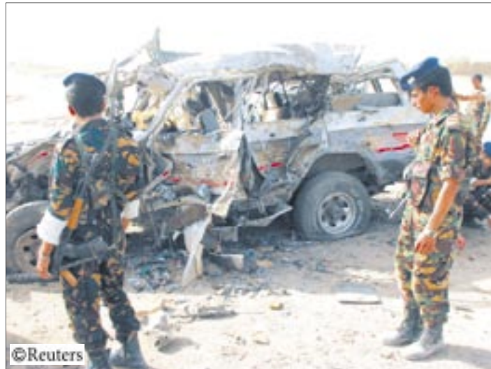
وفي سياق حديثه أدان هذا العمل المتطرف الذي ارتكبه الارهابيون وقلة السياح الأمنيين متناسين أنهم بهذا العمل يقتلون النفس التي حرم الله إلا بالحق وقد قتلوا عدد من الضحايا لم يرتكبوا ظلما ولا عدوانا.

- رسالتي إلى الشباب ، أن يعوا الدين الإسلامي ، بقيمه الحميدة ، وتعاليمه السمحة ، وأن يتركوا أن قتل النفس البريئة لم ترد في أي بيانات العالم ، إلا بقصاص أو الجهاد دفاعا عن النفس ، وما عداه فهو كفر وإباحة وظلال ، ولا يرضى الدين بهذه الأعمال .