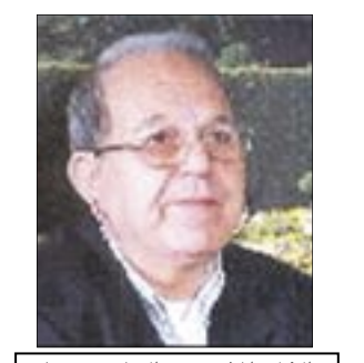
الشاعر المغربي عبدالسلام مصباح

جوبيتير الغالو-روماني، النسخة الأولى من نوتردام كنت كنيسة بديعة بناها الملك شيلدبرت الأول ملك الفرنجة وذلك عام ٥٢٨م، وأصبحت كاتدرائية مدينة باريس في القرن العاشر بشكلها القوطي.