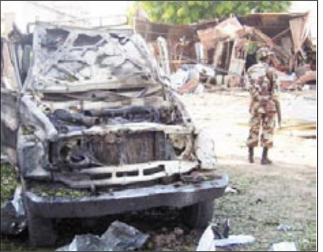
السلطات الصومالية تعلن عن حظر ليلي للتجول في مدينة بيدادوا

وأفسر الهجوم عن إصابة جيان في المخيم الجديد - وهو امتداد للمخيم القديم الذي أقامته وكالة غوث وتشغيل اللاجئين الفلسطينيين (أونروا) عام 1949، وتسبب بالاندلاع حرائق وتصاعد أعداد من النحاز الأسود. وكان الجيش اللبناني يدخل نهاية الأسبوع الماضي المخيم الجديد وفجر مبنى "صامد" الذي كان مقاتلو فتح الإسلام يطلقون النار منه. كما دمر مبنى التعاونية - أحد مراكز الجماعة- وربع أعلاما لبنانية على المركزي. ويريد الجيش من خلال القصف إرغام فتح الإسلام على التراجع جنوبا تجاه المخيم القديم.