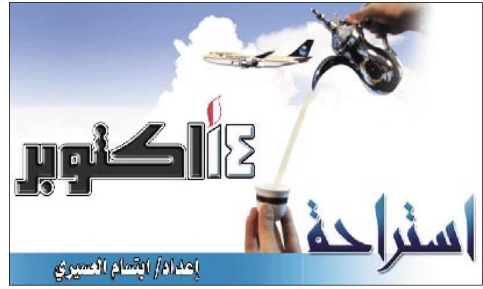
إعداد/ الإسام العسيري

في محاولة لتحطيم الرقم القياسي العالمي في .. التقبيل ، اجتمع حوالي ٦٥٠٠ زوج هنغاري في ساحة العاصمة المجرية بودابست. ويستهدف الهنغاريون من وراء هذا "العمل العنني" ، حسب ما ورد بجريدة "الراية" استرجاع اللقب العالمي الذي حققوه في العام ٢٠٠٤ لكنهم خسروه في العام الحالي لصالح الفلبينيين عندما تمكن ٦٢١٤ زوجاً فلبينييناً من تقبيل بعضهم بعضاً لأكثر من ١٠ ثوان. والجدير بالذكر أن الأزواج أصروا على تنفيذ خطوتهم أمام ساحة البرلمان في بودابست بتقبيل بعضهم لمدة لا تقل عن ١٠ ثوان ، ربما بهدف إضفاء شرعية برلمانية على فعل هو على أية حال غير مبرر عند أغلبية شعوب العالم ، فضلاً عن سعيهم لدخول موسوعة جينيس للأرقام القياسية .