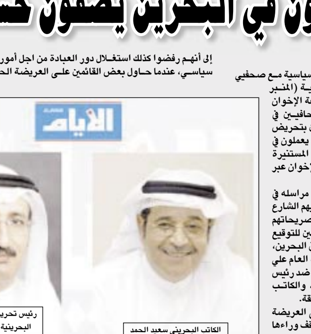
رئيس تحرير صحيفة "اليوم" البحرينية عيسى الشاذلي