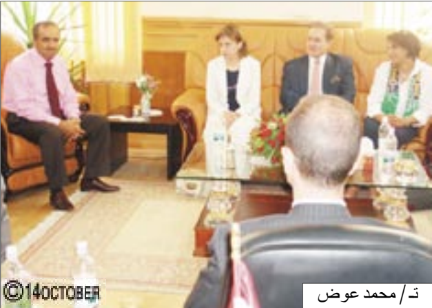
ت/ محمد عوض

رحب بها والوفد المرافق لها باسم المجلس المحلي والمكتب التنفيذي في المحافظة واعرب عن تمنياته في أن تسهم هذه الزيارة في المزيد من تعزيز العلاقات بين البلدين الصديقين والاستفادة من التجربة الإسبانية لتطوير المجال السمكي في المحافظة. فيما قالت الوزيرة الإسبانية ان زيارتها تهدف الى معرفة الواقع على الأرض لتعزيز علاقات التعاون. وكانت السيدة الينا سيبونوزا قد قامت والوفد المرافق لها بزيارة استطلاعية لكل من ميناء الاصطيد بحجيف في مديرية الغواهي وسوق حراج الاسماك في مديرية صيرة ومركز ابحاث تربية الأحياء