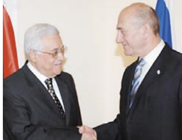
وهذا أول قتل منذ سريان هدنة

□ الأراضي المحتلة / وكالات: قتل فلسطيني في اشتباكات صباح أمس بين حركة المقاومة الإسلامية (حماس) وحركة التحرير الفلسطينية (فتح) هي الأولى منذ سريان هدنة قتل ثلاثة أسابيع. وقال شهود ومسؤولو مستشفيات إن مسلحين من حماس قتلوا عضوا من فتح في رفح جنوب قطاع غزة. وقالت حركة (فتح) إن الاشتباك وقع عند تصدي مسلحي حماس لقيادة من فتح عند منزله، وقتل شقيق الرجل حسب مسؤولين في المستشفى وأصيب تسعة أشخاص. وأكدت حماس وقوع الاشتباك لكنها قالت إن رجالها قتلوا النار ردا على