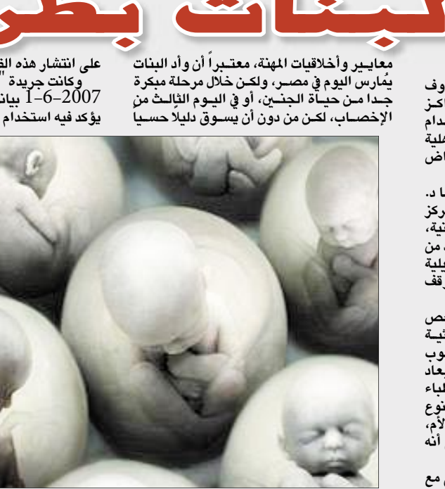
البيقية ص 2

على انتشار هذه الظاهرة. وكانت جريدة «المصري اليوم» قد نشرت في 2007-16 بياناً من اتحاد المصريين في أوروبا يؤكد فيه استخدام هذا الأسلوب في عدد من مراكز معايير وأخلاقيات المهنة، معتبراً أن وأد البنات يمارس اليوم في مصر، ولكن خلال مرحلة مبكرة جدا من حياة الجنين، أو في اليوم الثالث من ولادته، بأنه عودة لعصر الجاهلية الأولى، وواد للبنات تحت ستار تجنب الأمراض الوراثية. وقال رئيس اتحاد المصريين في أوروبا د. عصام عبد الصمد، وهو أحد الأطباء بمرکز محمد المنقسي للخصوبة بالعاصمة البريطانية، إن هذه التقنية تستخدم بشكل سيء في عدد من مراكز الإخصاب، وأنه ستوجه بمذكرة تفصيلية إلى شيخ الأزهر وتباقية الأطباء المصرية لوقف التعاليم بالأخنة. وقال إن هذه التقنية تستخدم في الأصل لفحص الكروموزومات، وفحص الأمراض الوراثية لتجنبها والكشف عن أي تشوهات أو عيوب خلقية، وليس لتحديد نوع الجنين واستبعاد غير المرغوب فيه، مشيراً إلى أن بعض الأطباء في مصر يستغلون هذا المنهج العلمي لمعرفة نوع الجنين في مرحلة النطفة قبل وضعها في رحم الأم، ثم يستبعدون الكروموزوم X الذي يدل على أنه أنثى ويبقون على الكروموزوم Y لأنه ذكر. وأكد أن هذا الأمر مؤتم أخلاقياً ويتنافى مع