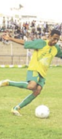
نجم سبأ ذمار

توجت بعثة المنتخب الأولمبي اليمني لكرة القدم أسس الأحد في العاصمة الأوزبكية طشقند استعدادا للقاء نظيره الأوزبكي الأربعاء القادم في ختام تصفيات آسيا الأولمبية ضمن المجموعة السادسة التي تضم إلى جانبها منتخبني كوريا الجنوبية واليابان.