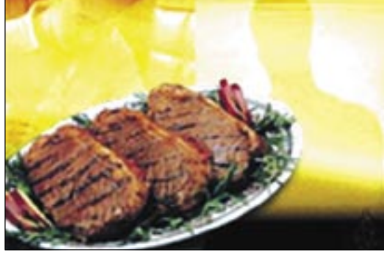
وباستخدام 28 مجموعة غذائية حدد الباحثون نمطين غذائيين رئيسيين هما نمط

اللحوم والدهون ونمط الخضروات والفاكهة. ووجد الباحثون الذين نشرنا نتائجهم في طبيعة مايو/من دورية التغذية الإكلينيكية أن نمط اللحوم والدهون يزيد بصورة ملحوظة من احتمال الإصابة بسرطان الخلايا الحرشفية للجلد، وازدادت المخاطر بصورة خاصة لدى الأشخاص الذين لديهم تاريخ مع سرطان الجلد والذين يستهلكون كميات كبيرة من اللحوم والدهون. وعلى العكس بدأ أن المخاطر تقل بصورة ملحوظة بين الذين يستهلكون كميات كبيرة من الفواكه والخضروات. وقال إيببيل إن هذه الدراسة هي "الأولى التي تتناول الصلة بين سرطان الجلد والتناول الاعتيادي لأنواع مختلفة من الأطعمة مقارنة بالتركيز التقليدي على الأطعمة الفردية". وأضاف أن النظام الغذائي يمكن أن يقلل المخاطر على ما يبدو وكذلك "البعد عن أشعة الشمس خلال ساعات الذروة واستخدام دهانات الحماية من الشمس والملابس الواقية".