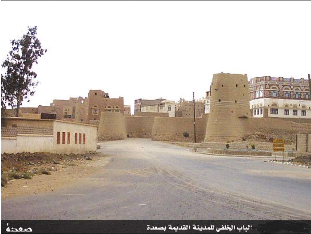
باب الخلفي للمدينة القديمة بصعدة

ولعلنا في ظل قيادة أمن عدن بقيادة العميد الركن / عبدالله قيران وهو غني بالخبر ومحبة الوطن حسن الإدارة والنقاش في أمور نشر الأمن والاستقرار في المجتمع ، وهذا مايسنا من قوة الانتشار الأمني في معظم الجولات والشوارع الرئيسية ، وهذا مايدعونا للفت نظره بضرورة الانتشار في الطرقات الفرعية والأحياء الشعبية التي تتخذها العصابات أي كرا لنشر جريمتها متخفية عن أنظار الشرطة ، والغريب في الأمر أنتنا نجد هذه العصابات تتخذ من ضعفاء النفوس في الأمن سترأ لاستمرارية أعمالها الإجرامية !! أنتنا نرى الخير في قيادة العميد الركن عبدالله قيران ، ونأمل استمرارية التجديد والقطاع لما هو خير لوطن والمواطن .