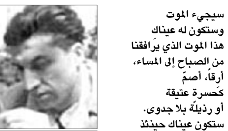
الشاعر الإيطالي شيزاري بافيري (١٩٠٨ - ١٩٥٠)