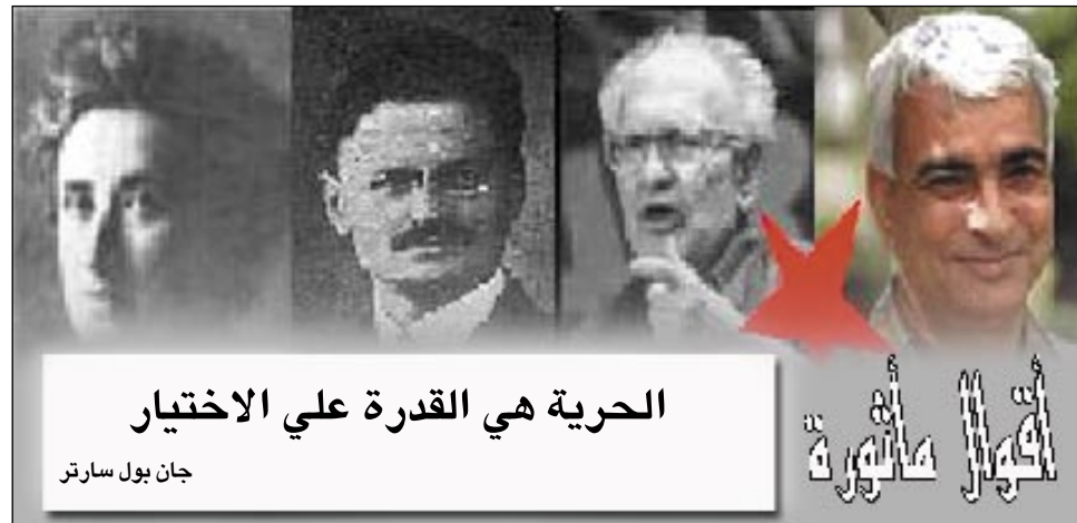
جان بول سارتر

التحدث بالماتف أثناء القيادة يعرضك للمساءلة القانونية مع تقيات إدارة أمن محافظة عدن عزيزي السائق .. تذكر أن: