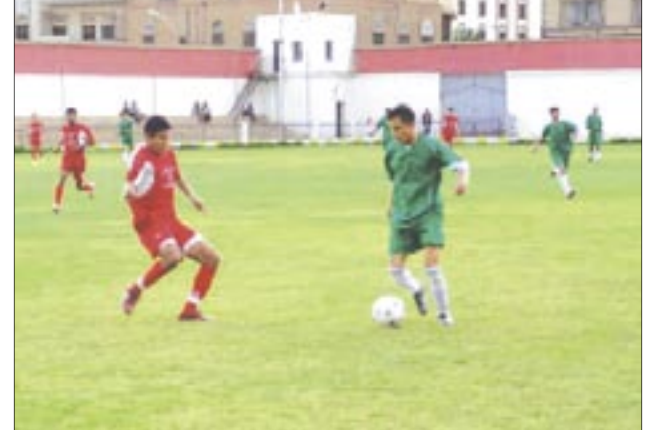
فريق شباب الجبل.

القدس من اب بصعوبة بهدف وحيد وفي مدينة الشحر بحضوريات ائتزع فريق تضامن شوبة فوزاً ثميناً من ايتاب مضيفة سمعون بهدف وحيد. وفي محافظة شبوة