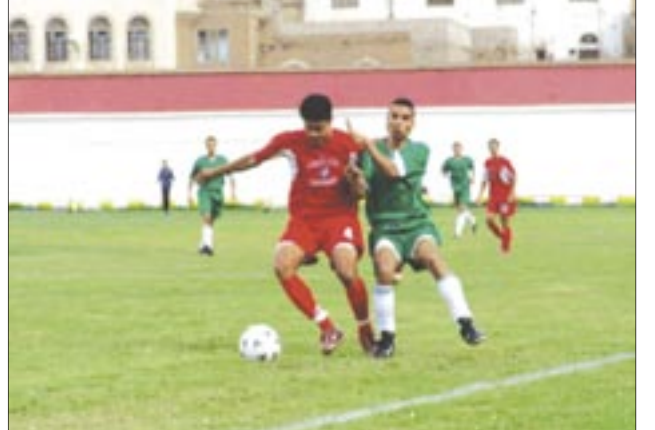
فريق شباب الجبل.