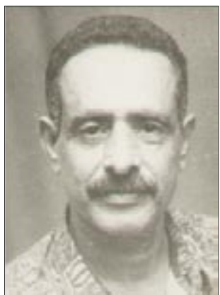
محمد عبد الجليل

منطلقات اليمنيين في صناعة حياتهم على الأرض، هي تقسها بالأمس واليوم وغدا، مثلهم مثل كل شعوب الأرض، الذين الخير لكل إنسان، وأن يشركوا كل الناس في صناعة حاضرهم ومستقبلهم الأجل، وأن يرسخوا الديمقراطية الوطنية بين الأفراد والجماعات، ويقيموا العدل والمساواة بينهم، وفقاً للدساتير والقوانين والنظم المستوعبة والمرعية من قبلهم جميعاً.