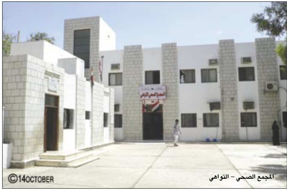
المجمع الصحي - التواهي