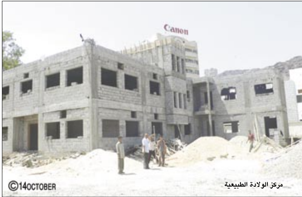
مركز الولادة الطبيعية