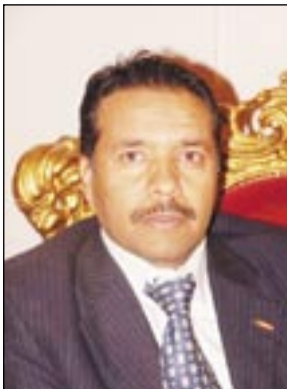
شغل منصبين في آن واحد باعتبار ان ذلك يتعارض مع النظم واللوائح الاولمبية الدولية.