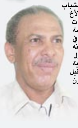
عبدالله قائد علي

منذ ان وطأت قدماه مبنى وزارة الشباب والرياضة بعد تعيينه وزيرا لها عقد الأخ حمود محمد عباد اجتماعا هاما ببيادات الوزارة والإدارات وأوضح لهم سياسة عمله للمرحلة القادمة ، مشددا على عزمه في محاربة بؤر الفساد على العمل الرياضي وأنه على استعداد للوقوف في وجه كل فاسد تسول له نفسه عرقلة تنفيذ المشاريع الرياضية الوزارة وشدد على ضرورة الالتزام بقانون أو يتخالف في تنفيذ ما يتم اقراره من قبل الوزارة وشدد على ضرورة الاهتمام بمتابعة المناقصات والمؤسسات المنفذة للمشاريع والشركات والمؤسسات المنفذة لكل مشاريع الشباب والرياضيين وأن يكون التنفيذ وفق المواصفات الفنية التي يتم اعتمادها وان يتم الالتزام بقانون المناقصات وضرورة الاهتمام بمتابعة الشركات والمؤسسات المنفذة للمشاريع وان يتم الاهتمام على العمل وان يؤدي كل واحد عمله باتقان وبيت في القضايا والمهام المطروحة امامه اول باول ولا يؤجل عمل اليوم للغد . الوزير يحمل رسالة واضحة المعالم والايعاد مترجما مطالب به فخامة الرئيس القائد / علي عبدالله صالح رئيس الجمهورية بضرورة محاربة الفساد والمفسدين والمتلاعبين بقضايا الناس والمعطلين للعمل وان وجود الفساد والمفسدين وهي رسالة يجب ان يفهمها الجميع في ظل سعي بلاننا الى الرقي والتقدم وانجاز المشاريع والمهام التي تهم المجتمع . خطوة مثل هذه تستحق منا التقدير والاحترام لمعالى الوزير عباد وتنتمي من الجميع ان يكون نغص الهه الذي يشعر به الوزير من اجل قضايا الشباب والرياضيين والرقي بها وخلق رياضة يمنية متطورة تضاهي الاخرين .