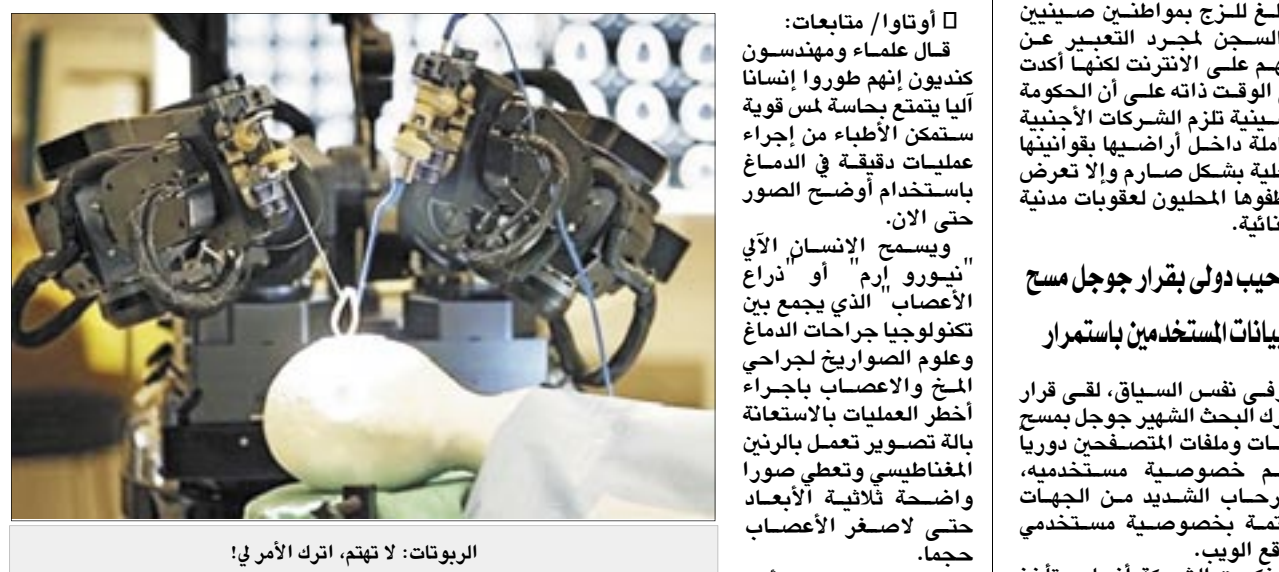
الروبوتات: لا تهتم، اترك الأمر في!

واشنطن/ متابعات: قال علماء ومهندسون كنديون إنهم طوروا إنساناً آلياً يتمتع بحاسة لمس قوية تمكن الأطباء من إجراء عمليات دقيقة في الدماغ باستخدام أوضح الصور حتى الآن. ويسمى الإنسان الآلي "نيورو أرم" أو ذراع الأعصاب الذي يجمع بين تكنولوجيا جراحات الدماغ وعلوم الصواريخ لجراحي المخ والأعصاب بإجراء أخطر العمليات بالاستعانة بالصور ثلاثية الأبعاد المغناطيسي وتعطي صورة واضحة ثلاثية الأبعاد حتى لاصفر الأعصاب حجماً. ومن المتوقع إجراء أول عملية بالاستعانة بالإنسان الآلي في نيورو أرم" هذا الصيف في مستشفى فورتيل في كاليفارنيا. وجرى تطوير الإنسان الآلي الذي بلغت تكلفته ٢٧ مليون دولار كندي (٢٤ مليون دولار أمريكي) بالتعاون مع شركة ماكديونالد وديتويلر وشركاهما التي طورت ذراعاً آلياً أطلق عليه كند أرم لرحلات مكوكات الفضاء التابعة لإدارة الفضاء والطيران الأميركية (ناسا).