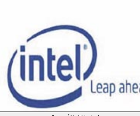
شعار إنتل الأمريكية

واشنطن/ متابعات: تعزز شركة إنتل الأمريكية إنتاج أجهزة كمبيوتر صغيرة الحجم تتصل مباشرة بالإنترنت بدلاً من طرح معالجات تقوم بتشغيل هذه الأجهزة. وأطلقت عليه اسم مؤقت هو "مكاسلين" وهو على هيئة جهاز كمبيوتر صغير للغاية في حجم التليفون المحمول يتصل مباشرة بالإنترنت ويتراوح حجم شاشة من ٤.٥ إلى ٦ بوصات. ويعمل الجهاز بنظام لينوكس وليس بنظام ويندوز المحمول ويتسهدف هذا الجهاز المستخدمين التقليديين وليس المحترفين، ويتصل بالإنترنت عن طريق الاتصال اللاسلكي بتقنية واي فاي.