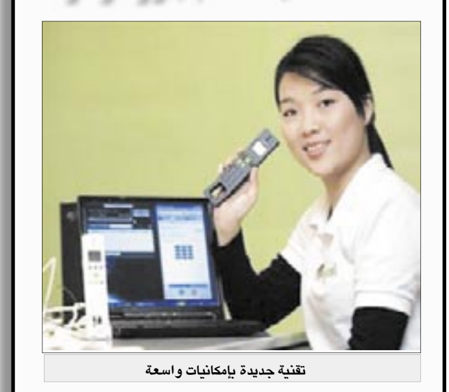
تقنية جديدة بإمكانها واسعة

القاهرة / متابعات: توقع خبراء أن تشهد منطقة الشرق الأوسط نمواً كبيراً في الاتصالات المبنية على تقنية بروتوكول الإنترنت في الأعوام القليلة المقبلة وأن يتنامى الطلب على هذا النوع من الاتصالات على حساب الاتصالات التقليدية عبر الهواتف العادية.