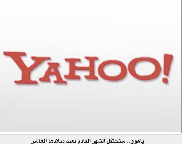
ياهو.. ستحتفل الشهر القادم بعيد ميلادها العاشر

واشنطن/ متابعات: تظل مشكلة الرقابة على الإنترنت وحماية خصوصية المستخدم من الأمور الشائكة التي يصعب التغلب عليها بين يوم وليلة ، ويزيد من صعوبة المشكلة ما تقوم به الشركات الكبرى من تزويد الحكومات ببيانات متصفحها مثلما فعلت شركة ياهو عندما قدمت معلومات ساعدت الحكومة الصينية على مراقبة مواطني صيني وهو ما دفعه لرفع دعوى قضائية ضدها. وقد حظيت الدعوى القضائية بدعم الفرع الأمريكي من المنظمة العالمية لحقوق الإنسان الذي يتخذ من واشنطن العاصمة مقراً له والذي أكد أن شركة ياهو تستفيد ملياً من السلطات الصينية مشيراً إلى أن الصين هي ثاني أكبر سوق للإنترنت في العالم. ومن جانبها، أصدرت شركة ياهو بياناً أعربت فيه عن الأسف البالغ للزوج بواطني صينيين في السجن لجحد التعبير عن رأيهم على الإنترنت لكنها أكدت في الوقت ذاته على أن الحكومة الصينية تلزم الشركات الأجنبية العاملة داخل أراضيها بقوانينها المحلية بشكل صارم ولا تعرض موظفيها المحليين لعقوبات مدنية وجنائية.