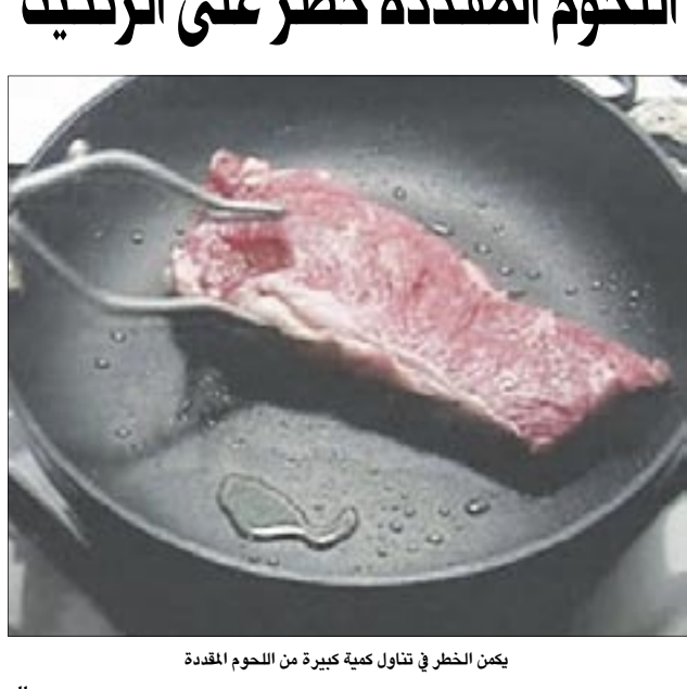
يمكن الخطر في تناول كمية كبيرة من اللحوم المقددة

لندن/ متابعات: أظهرت نتائج بحث طبي جديد أن تناول كمية كبيرة من اللحوم المقددة يمكن أن يزيد خطر الإصابة بالأمراض الرئوية. وطبقاً لما ورد بجريدة القدس العربي، أوضحت الدراسة أن الذين يتناولون اللحوم المقددة لما لا يقل عن 14 مرة في الشهر يصابون بمرض الانسداد الرئوي المزمن، مشيرة إلى أن النيترات الموجودة في اللحوم ربما تكون المسؤولة عن هذه الحالة. من جانبه، قال الدكتور روي جيانج، الذي أعد الدراسة: إن نسبة عالية من النيترات تستخدم