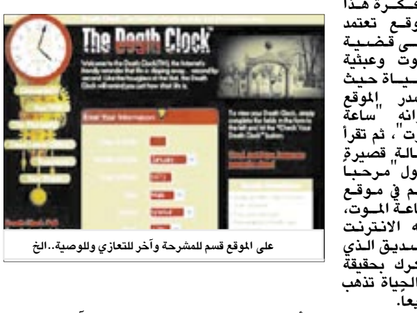
على الموقع قسم للشرح وآخر للتعاوي وللوصية.. الخ

مواقع الكتانية / متابعات: يحتوي عالم الإنترنت على مواقع متخصصة في هوابات عجيبة وطريفة أقرب ما تكون إلى الجنون، أحد هذه المواقع هو deathclock.com. وفكرة هذا الموقع تعتمد على قضية الموت وعقوبة الحياة حيث يتصدر الموقع عنوانه ساعة الموت، ثم تقرأ رسالة قصيرة تقول "مرحباً بك في موقع ساعة الموت، منبه الإنترنت الصديق الذي يذكر بحقيقة أن الحياة تذهب سريعاً."