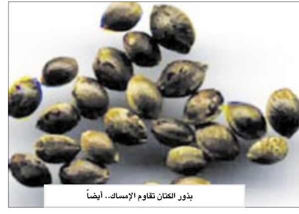
بذور الكتان تقاوم الإسهال.. أيضاً

عمان/ متابعات: أكد خبراء الصحة أن بذور الكتان تتميز بفوائدها العديدة التي تقدمها لصحة الإنسان، لما تحتويه من الحوامض الدهنية غير المتشعبة من فئة 3-1، التي تمثل وقاية طبيعية من أمراض القلب والشرايين. وأوضح الخبراء أن بذور الكتان تحتوي على ضعف نسبة البروتينات الجيدة المتوفرة في الأسماك، فضلاً عن ذلك لا يستهلك الجسم أي نسبة من السكريات الموجودة في بذور الكتان لأنها موجودة في صورة ألياف بكتينية غير قابلة للهضم والامتصاص. وطبقاً لما ورد بجريدة القبس، يشير الخبراء إلى أن بذور الكتان تحتوي على نسبة مرتفعة من البكتين "الألياف"، وفي ذلك يمكن سرها في الحيلولة دون الإصابة بالأمساك، كما أنها تساعد في تخفيض معامل الجليكيميا في كل وجبة طعام، مما يسهل عملية تخفيض الوزن، حيث يحد البكتين من الشعور بالجوع. وينصح الخبراء بتخصيص بذور الكتان على النار، أو طحنها في الخلاط، شريطة ألا يتم تخزينها بعد ذلك فترة طويلة بل يتم استهلاكها خلال فترة قصيرة، ويمكن إضافة بذور الكتان كاملة أو مطجونة إلى جميع الوجبات تقريباً: الحساء، السلطة، الكفتة والكباب، الحلويات.