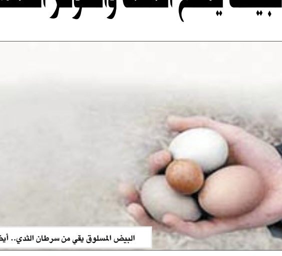
البيض المسلوق بقي من سرطان الثدي.. أيضاً