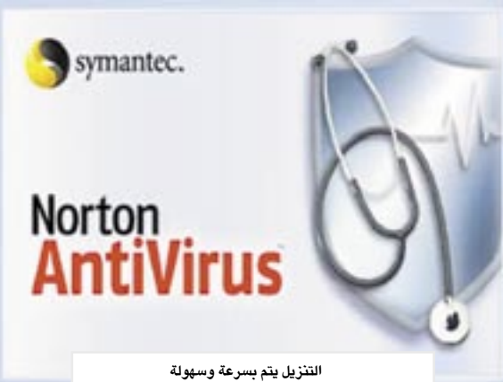
التنزيل يتم بسرعة وسهولة

واشنطن/ متابعات: عقدت شركة جوبل اتفاقاً مع سيمانتيك لتوفير البرنامج Norton Internet Scan ضمن حزمة برمجيات Google Pack، وهي مجموعة مجانية من البرمجيات الأساسية تقدمها للمستخدمين لحماية حواسيبهم وتحسينها. وتتيح حزمة جوبل تنزيل البرنامج "نورتون سيكيوريتي سكان" والتطبيقات الأساسية الأخرى بسرعة وسهولة، مع حصول المستخدمين باستمرار على الميزات الجديدة في برامجهم المضلة بفضل احتواء الحزمة على ميزة Google Updater التي تعمل على تحديث الحزمة باستمرار. ويقوم البرنامج بإجراء مسح للحاسوب بحثاً عن الفيروسات وبرمجيات التجسس وإزالة جميع الفيروسات وأحصنة طروادة والديدان البرمجية الموجودة. وتتوفر حزمة جوبل التجريبية بانفتي عشرة لغة، وتعمل على نظامي ويندوز إكس بي وفيسستا، وتدعم المنصفين إنترنت إكسبلورر 7.0 وفلايفوكس 1.0 وما بعدهما، ويمكن الحصول على برنامج "نورتون سيكيوريتي سكان" كجزء من حزمة جوبل من الموقع: pack.google.com