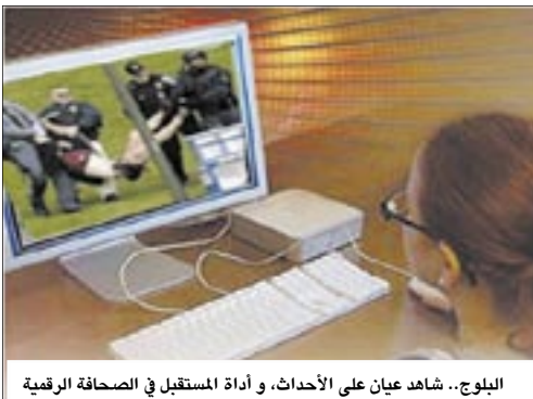
البلوج.. شاهد عيان على الأحداث، وأداة المستقبل في الصحافة الرقمية

ولم تعد المدونة وسيلة للتعبير عن الرأي فقط بل أصبحت جزءا أساسيا من طرق التدريس الحديثة. حيث أكدت الأبحاث الأسترالية أن البلوج أو المدونات تساعد الطلاب على التفكير وكتابة المزيد من الانتقادات، فقد أوضحت الباحثة "أنا بارتليت" المحاضرة بجامعة التكنولوجيا بالولايات المتحدة والتي تعتمد في محاضراتها على الويب بلوج منذ عام 2001 أن البلوج أو المدونات تساعد الطلاب على التفكير بجرية كما تعلمه المسؤولية والاتصال الصحيح بالعالم الخارجي.