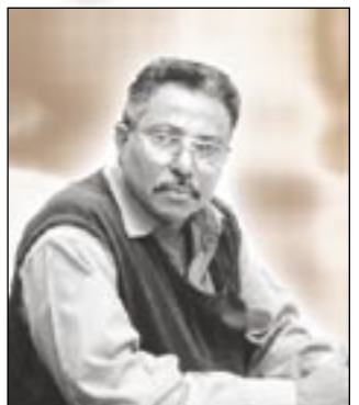
إقبال علي عبدالله

□ أنتم جميعاً اليوم في وطن يقوده زعيم أصيتموه واحترمتوه وبإدراككم الوفاء .. ومنح لكم حرية الاستثمار في اليمن .. إنه فخامة الأخ الرئيس / علي عبدالله صالح رئيس الجمهورية اليمنية الذي يتحمل بنفسه اليوم ملف الاستثمار لإبرائه ماذا يجوده تجذب المستثمرين ، مشاريع تنموية وأخرى خدمية وترفيهية كلها محمية بتشريعات وقوانين سننها ووفرتها الحكومة اليمنية بما يجعل من الاستثمارات المحلية والأجنبية والعربية والأجنبية في مظلة الأمن والأمان والاستقرار .