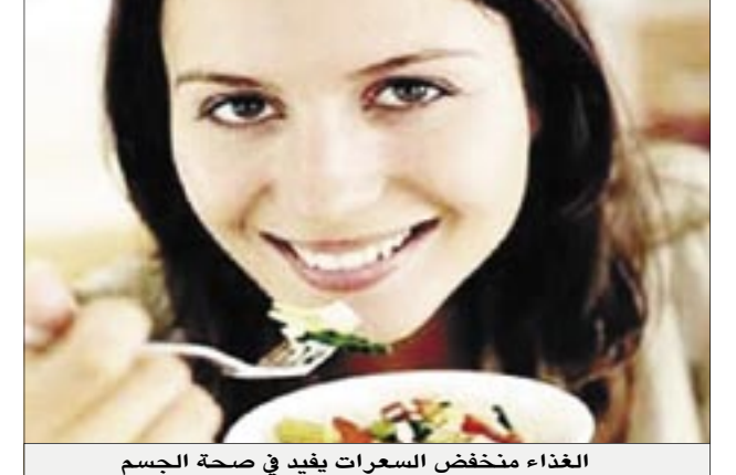
الغذاء منخفض السعرات يفيد في صحة الجسم

فقط في المراحل المتأخرة من الحياة لا يزيد من فرص طول العمر فقط، بل يمكن أن يلعب دورا في منع الإصابة بالسرطان. وأشارت الدراسة إلى أن الغذاء ذا السعرات الحرارية المنخفضة يمكن أن يحفز الجسم على التخلص من الخلايا المتضررة التي تكون في طريقها إلى التحول لخلايا سرطانية.