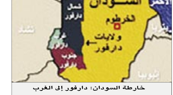
خارطة السودان: دارفور إلى الغرب

أكبدا، وهو أن "الكثير من مياه البحيرة ربما يكون تسرب من خلال الطبقة الحجرية الرملية ليجتمع كمياء جوفية". وتحتل البحيرة مساحة 19200 ميل مربع تقريبا، ويشير مداها الواسع إلى أنها وجدت منذ فترة طويلة تعود إلى الزمن الذي كانت تتساقط فيه أمطار غزيرة على الصحراء الشرقية حسب العالمين. وقالت غنيم إن البحيرة القديمة تمثل دليلا لا يمكن دحضه على الزمن الذي كانت تتساقط فيه الأمطار على الصحراء الشرقية. وأضافت العالمية أنه سيكون لهذا الاكتشاف نتائج مهمة لتسعين معرفتنا بالتغيرات المناخية القارية وعلم المياه القديمة. وقال إليان إن هناك شيئا واحدا