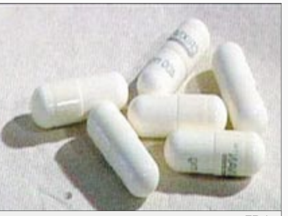
FDA طالبت الشركة المصنعة للدابوكستين إجراء اختبارات إضافية جديدة

الرياض/ متابعات: ينتظر الملايين من المصابين بسرعة القذف موافقة هيئة الغذاء والدواء الأمريكية FDA على عقار "دابوكستين" الذي يعتبره الأطباء أفضل علاج لسرعة القذف، إلا أن المركز لم يتقن له التأكد حتى الآن من فاعلية الدواء. وطبقا لما ورد بجريدة "الرياض"، قام فريق طبي في جامعة مينيسوتا الأمريكية تحت قيادة الدكتور برايور Pryor باختيار 2614 رجلا يعانون من القذف المبكر المعتدل أو الشديد، وعولج نصفهم بالدابوكستين، والنصف الآخر بالحبوب الكاذبة لمدة 3 أشهر، فأظهروا أن هذا العقار مد فترة القذف بعد الولوج من 90 ثانية إلى حوالي 3 دقائق إذا ما استعمل جرعة 30مجم، ومن 90 ثانية إلى حوالي 3 دقائق ونصف إذا ما كانت جرعة 60مجم، بينما لم يتعد تمدد تلك الفترة إلا من 90 ثانية إلى دقيقة و75 ثانية مع استعمال الحبوب الكاذبة مما يعني أن هذا العقار ساعد على تأخير حصول القذف حوالي 3 إلى 4 أضعاف مقارنة بضعفين للحبوب الكاذبة مع أعراض جانبية طفيفة أبرزها الغثيان. ورغم تلك النتائج الإيجابية، إلا أن FDA لا يزال متحفظا بالموافقة عليه، وقد أصدر على اختبارات إضافية جديدة من الشركة المصنعة للتأكد من فعاليته وسلامته.