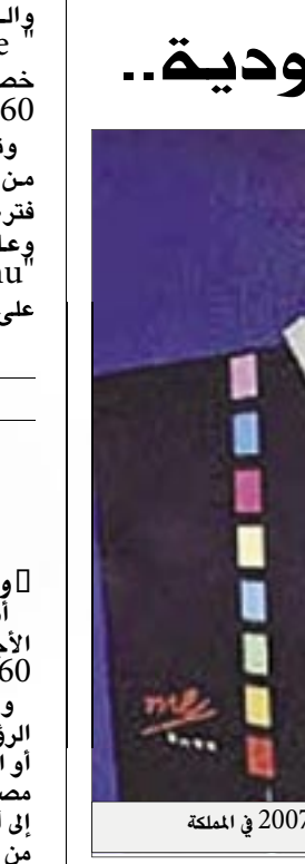
16 أبريل افتتاح المعرض الدولي للساس تقنية المعلومات 2007 في المملكة