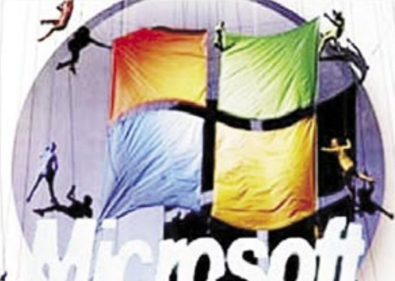
تسعى مايكروسوفت إلى استحداث تقنيات بحث جديدة.. أيضا

الشركة الشهري الملفات التي تصحب بعض الثغرات في برامجها بشكل دوري ومن وقت لآخر لسد الطريق أمام أية ثغرة يمكن أن يستغلها قرصنة الكمبيوتر لاختراق نظام التشغيل أو برامج الكمبيوتر الأخرى التي تصورها مايكروسوفت. وأكدت الشركة أن هذه الملفات ستعمل على سد ثغرات في كل من ويندوز وحزمة برامج أوفيس إكس بي، وأحد هذه الملفات سيسد ثغرة تم اكتشافها في أحدث البرامج الأمنية المعروف باسم وان كير وبرنامج فور فرونت وبرنامج أنتيجين.