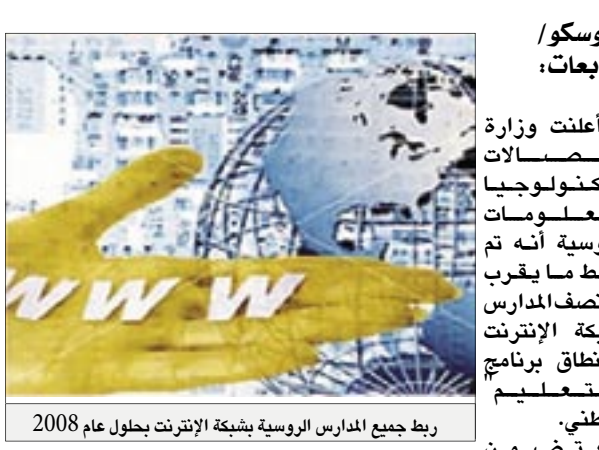
ربط جميع المدارس الروسية بشبكة الإنترنت بحلول عام 2008

أعلنت وزارة الاتصالات وتكنولوجيا المعلومات الروسية أنه تم ربط ما يقرب من نصف المدارس بشبكة الإنترنت في نطاق برنامج التعليم الوطني. ويتمسك البرنامج الوطني "التعليم" ربط جميع المدارس الروسية بشبكة الإنترنت بحلول عام 2008، حيث يبلغ عدد المدارس المطلوب ربطها بالإنترنت نحو 62 ألف مدرسة وفقا لمعطيات الوكالة الفيدرالية للتعليم. وتتركز أكثر من 70 بالمائة من المدارس المطلوب ربطها بالإنترنت خلال عام 2007 في المناطق الريفية والمناطق الصعبة الوصول في روسيا.