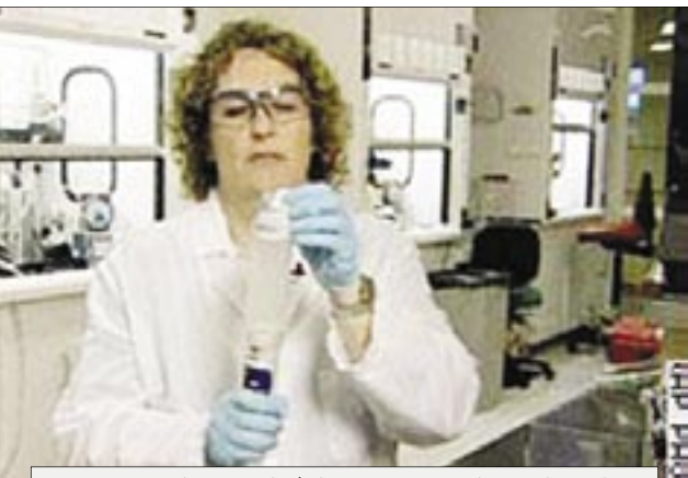
التقنية الجديدة المطورة تشبه عملية إطفاء الكمبيوتر وإعادة تشغيله

على المشروح قد اضطر إلى نقل أبحاثه إلى جامعة ساو باولو البرازيلية، بعدما اصطدم عمله بتجاهل تام من قبل الباحثين الأمريكيين. يذكر أن مرض السكري من الفئة الأولى يصيب صغار السن نتيجة خلل في جهاز المناعة، يدفع الكريات البيضاء في الدم إلى مهاجمة الخلايا المسؤولة عن إنتاج الأنسولين الطبيعي الذي يحرق السكر في الجسم. ويتعرض مرضى السكري لمشاكل في جهازهم العصبي، وإلى أمراض القلب والكلية وفقدان البصر، ويعتقد أن مليون شخص مصاب بهذا المرض في الولايات المتحدة وحدها، علماً أن النوع الأكثر شيوعاً هو من الفئة الثانية ويصيب كبار السن. وتقوم التقنية التي طورها العلماء على عزل الخلايا الجذعية واستخراجها من دم المرضى، قبل أن يتم قتل خلايا جهاز المناعة باستخدام مواد كيميائية خاصة. ويعاد لاحقاً ضخ الخلايا الجذعية في دماء المرضى