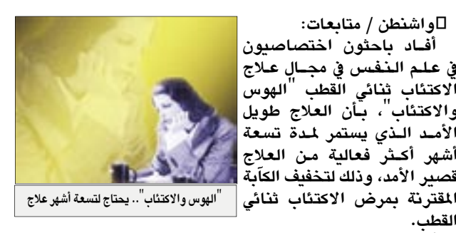
اليوس والاكتئاب... يحتاج لتسعة أشهر علاج

واشنطن / متابعة: أفاد باحثون اختصاصيون في علم النفس في مجال علاج الاكتئاب ثنائي القطب "اليوس والاكتئاب"، بأن العلاج طويل الأمد الذي يستمر لمدة تسعة أشهر أكثر فعالية من العلاج قصير الأمد، وذلك لتخفيف الكتابة المقترنة بمرض الاكتئاب ثنائي القطب. وأشار الدكتور دافيد ميكوليتز من جامعة كولورادو بحسب صحيفة النيويورك تايمز إلى أن الدراسة تؤكد أن الأدوية المستخدمة لعلاج الاكتئاب ثنائي القطب وبين نوبات الاكتئاب ذات فائدة محدودة في حالة الاكتئاب ثنائي القطب المتكرر الحدوث. وكانت أوضحت الدراسة أنه بالرغم من أن كلفة العلاج عالية، إلا أن العلاج النفسي ليس بديلاً عن الدواء وأن إهمال العلاج يؤدي إلى آثار مدمرة على المرضى وأسره.