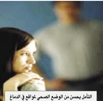
التأمل يحسن من الوضع الصحي لمواقع في الدماغ

عن مجمع منظمات العلاج النفسي بالطب البديل - والذي يضم أكثر من 150 جمعية أمريكية حكومية وغير حكومية، وعدم الكليات التي تدرس الطب البديل - إلى ممارسة التأمل كوسيلة لتحسين الحالة الصحية والنفسية للأشخاص. يؤكد الخبراء والمعالجون بهذه الطريقة أن الشخص المتأمل لا يستفيد من هذا التأمل تمام الفائدة إلا إذا وصل لدرجة متقدمة ما يعرف باسم "الذهن المتأمل" وينسى مشكلاته ويسيطر في خيالاته، ولا شك في أن التركيز أو التفكير الهادئ في أصله من الأمور التي تعالج الضغوط النفسية والأمراض الجسدية. وقد كشفت دراسة علمية أن التأمل يحسن من الوضع الصحي لمواقع في الدماغ، ويقوي جهاز المناعة، حيث قام باحثون في جامعة ويسكونسن ماديسون الأمريكية مؤخراً بتجارب على 41 متطوعاً آثار ما يعرف باسم "التأمل المتأمل" وهو أسلوب جديد في التأمل ابتكره الاختصاصي جون كايان زن - ويهدف إلى مساعدة المرضى الذين يعانون من الألم وقلق الراحة.