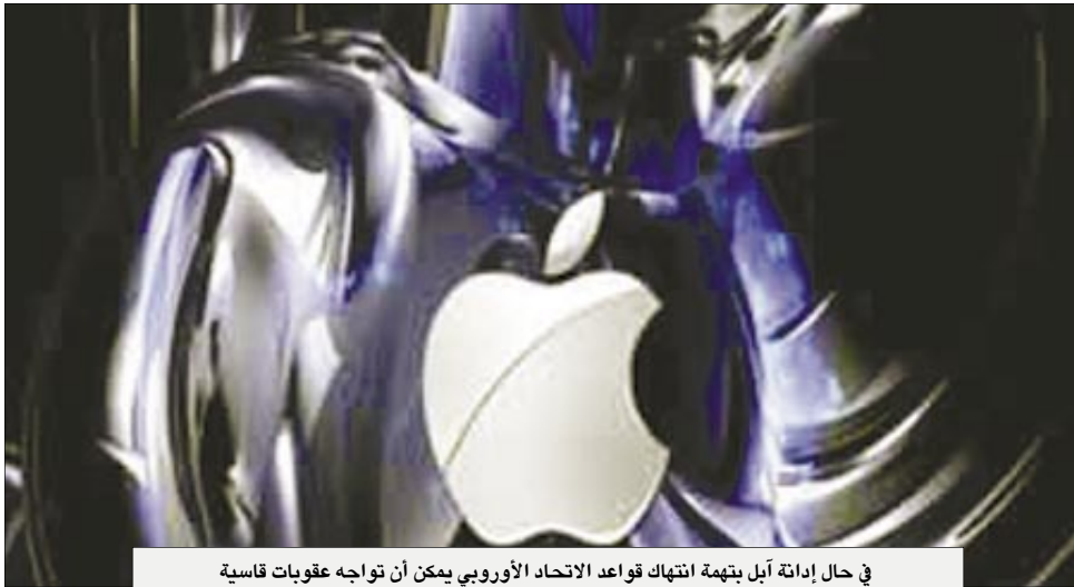
في حال إدانة آبل بتهمة انتهاك قواعد الاتحاد الأوروبي يمكن أن تواجه عقوبات قاسية

ما زال قائماً بين الطرفين منذ ثلاث سنوات تقريبا في حين ذكر المحامي العام لشركة مايكروسوفت أن المشكلات والغرامات التي واجهتها الشركة في أوروبا فريدة من نوعها. وليست هذه هي المرة الأولى التي تحدث فيها مواجهة بين المفوضية الأوروبية وشركة مايكروسوفت، ففي عام 2004 توصلت المفوضية إلى أن مايكروسوفت أساءت استغلال وضعها المهيمن في السوق فيما يتعلق بمشغلات الوسائط الصوتية والمرئية وخادمت أجهزة الكمبيوتر مما أضر بمنافسها الأصغر حجماً ممن لهم منتجات مماثلة.