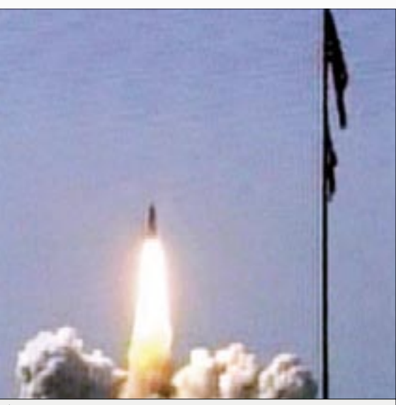
تتخوف إدارة بوش من زن تحاول إيران أو كوريا الشمالية إجراء تجارب نووية على مدار سراً