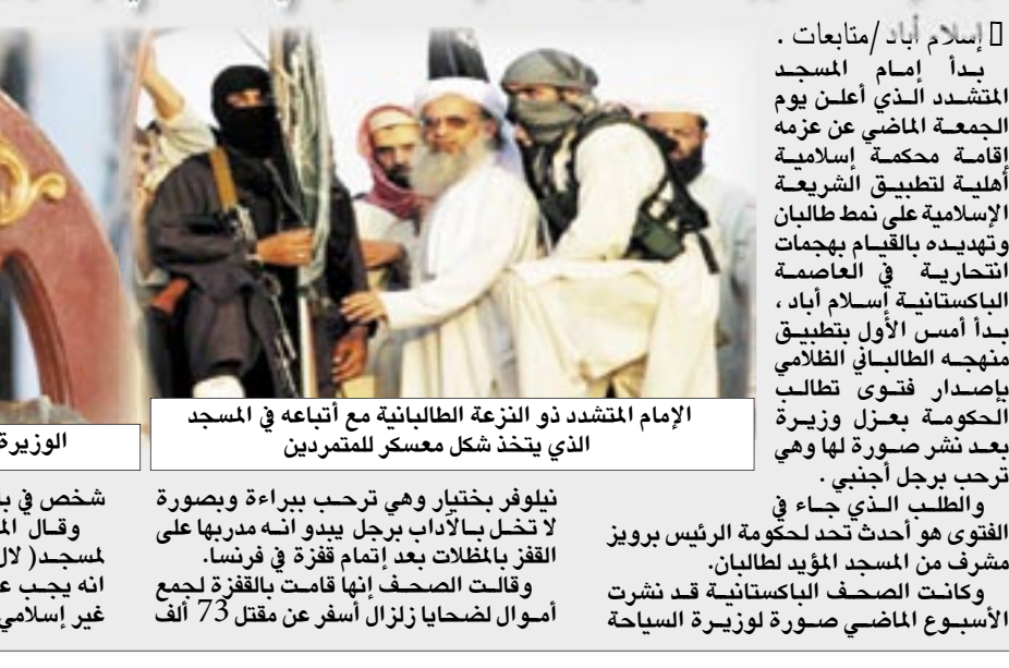
الإمام المتشدد ذو النزعة الطالبانية مع أتباعه في المسجد الذي يتخذ شكل معسكر للمتطرفين