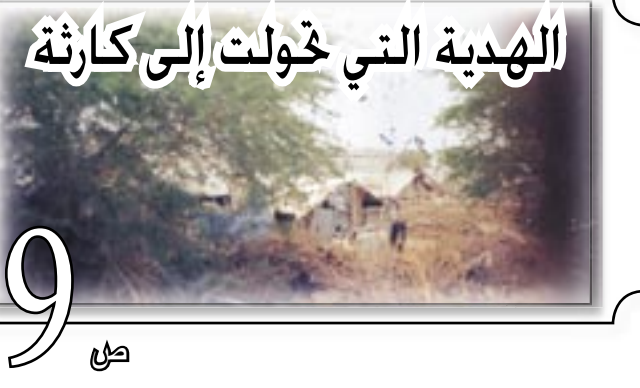
الهدية التي تحولت إلى كارثة