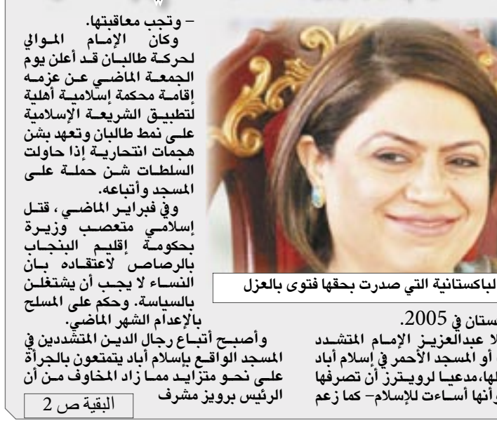
الوزيرة الباكستانية التي صدرت بحقها فتوى بالعزل