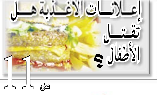
إعلانات الأغذية هل تقتل الأطفال