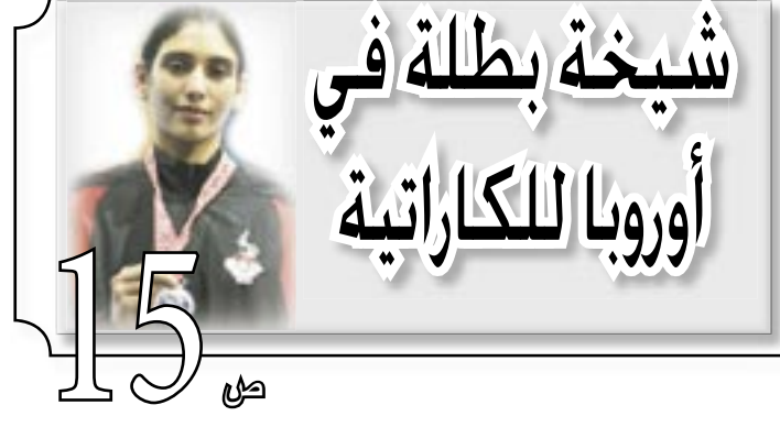
شيخة بطلة في أوروبا للكاراتية

اهداف الثورة اليمنية التحرر من الاستبداد والاستعمار ومخلفاتها وإقامة حكم جمهوري عادل وإزالة الفوارق والامتيازات بين الطبقات. بناء جيش وطني قوي لحماية البلاد وحراسة الثورة ومكتسباتها. رفع مستوى الشعب اقتصادياً واجتماعياً وسياسياً وثقافياً. إنشاء مجتمع ديمقراطي تعاوني عادل مستمد أنظمتها من روح الإسلام الحنيف. العمل على تحقيق الوحدة الوطنية في نطاق الوحدة العربية الشاملة. احترام مواثيق الأمم المتحدة والمنظمات الدولية والتمسك بمبدأ الحياد الإيجابي وعدم الانحياز والعمل على إقرار السلام العالمي وتدعيم مبدأ التعايش السلمي بين الأمم.