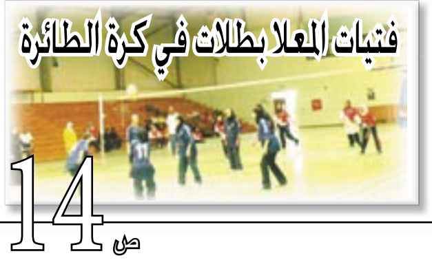
فنيات العلابلات في كرة الطائرة