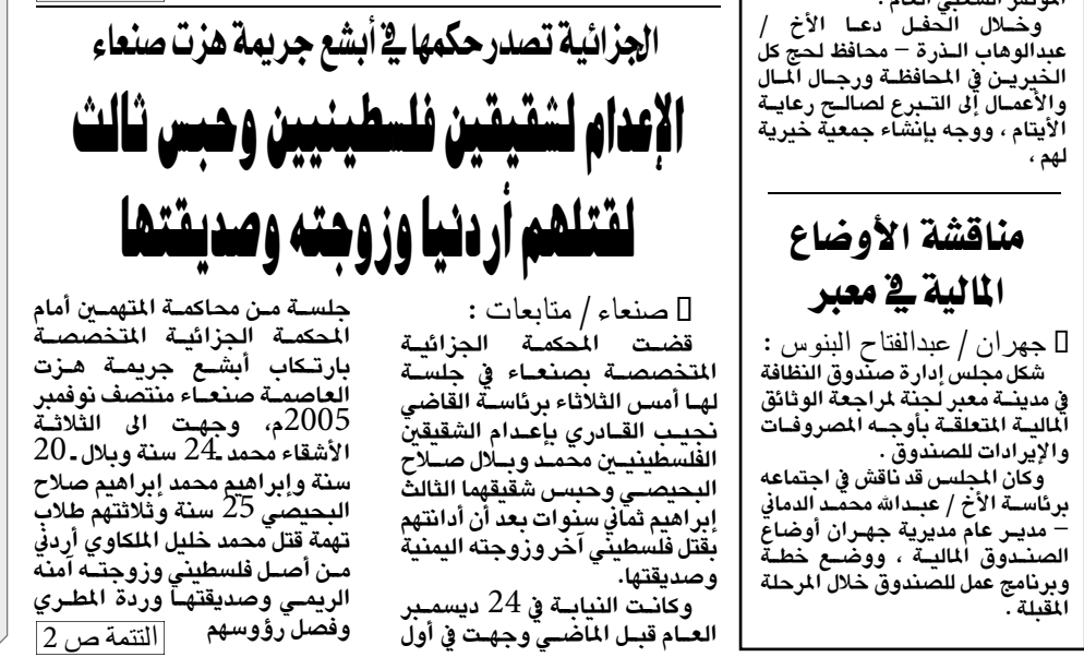
الجزائرية تصدر حكماً على أشع جريمة هزت صنعاء