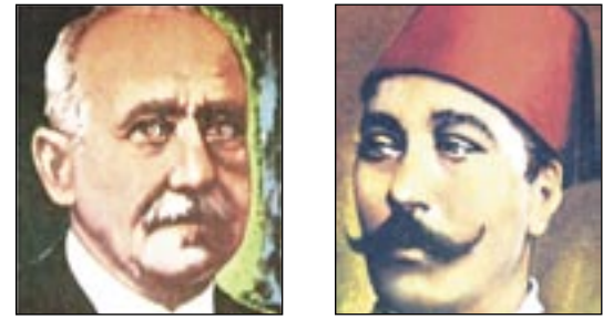
احمد شوقي الملك فاروق