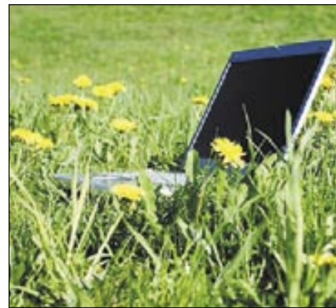
سيتمكن مستخدمو الإنترنت من نقل الروائح إلى الإنترنت واستنشاقها بحلول عام 2015

يتلون بحسب البيئة التي يقاثلون فيها إلى جانب كونه مضادا للرصاص وأقيا من الماء. جدير بالذكر أن كوريا الجنوبية واحدة من أكثر الدول تقدما في مجال التكنولوجيا ويستخدم حوالي 70%