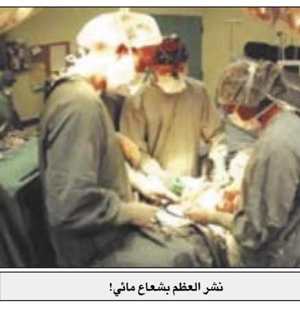
نشر العظم بشعاع مائي!

□ برلين / متابعات: تمكن فريق من جامعة هانوفر الألمانية، من تطوير تقنية جديدة لاستخدام الشعاع المائي في عمليات جراحة العظام في غرف العمليات. وأوضح المهندسون القائمون على المشروع، أن الشعاع المائي تفوق على سائر التقنيات الأخرى لنشر العظام، إذ أنه يمكن للجراحين من نشر العظام بالشكل الذي يرغبونه بدقة متناهية دون أن يترك أضرارا جانبية. ويشكل شعاع مائي قوي للغاية نواة المنشأ الجديد الذي يستطيع نشر العظام دون إلحاق أي ضرر بها، وينطلق الشعاع من ذراع أي مقبض عند حوض مائي يخرج منه أنبوب معدني صغير يتم إيماله بحيث يكون قريبا من العظام، ثم ينطلق منه شعاع مائي رقيق وقوي، يكاد لا يرى بالعين المجردة، في اتجاه العظام لينحول الشعاع إلى منشأ فخرز على نحو قويم العظام.