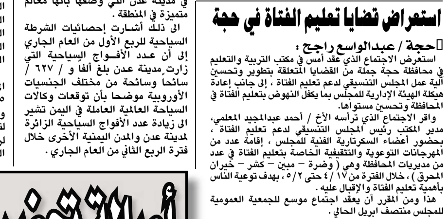
استعراض تضامياً تعليم الفتاة في حجة