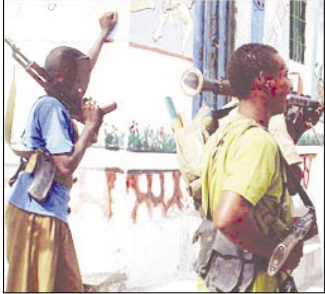
جنوبي مقديشو. وقالت مصادر عسكرية إنه لم تقع إصابات. من جانبها أضافت مصادر طبية بأن جنودا إثيوبيين داهموا أمس الأول مستشفى الحياه القريب من حي علي كاين الذي أصيب بالصف. وقال أحد الأطباء أن الإثيوبيين حطموا أبواب المكتاب وأختوا كل الأدوية واعتقلوا طبيبا، معربا عن استغرابه من هذه الفعلية، خاصة وأن العديد من المرضى الموجودين أساسا في المستشفى أصيبوا بجروح نتيجة سقوط ذائف عليهم.

□ مقديشو/عواصم/وكالات: وصل مزيد من التعزيزات العسكرية الإثيوبية إلى الصومال أمس في خامس أيام المعارك بين الجيش الإثيوبي والقبايل والمسلحين الصوماليين في مقديشو. وترافق هذا الحدث مع وصول الرئيس الأوغندي يوري موسيفيني إلى إريتريا لبحث الوضع الراهن في الصومال مع المسؤولين هناك. ويأتي وصول التعزيزات العسكرية الإثيوبية في وقت دخلت فيه المعارك مع القبايل والمسلحين الصوماليين يومها الخامس والتي أسفرت عن مقتل عشرات الأشخاص، حسب تأكيدات شهود العيان والقوات الإثيوبية. ورغم الهدوء النسبي الذي شهدته مقديشو صباح أمس فقد تواصل تبادل إطلاق نار بشكل متقطع في حيي المعب الذي شهد اعتف الموجبات خلال الأيام الماضية. كذلك بدت نشاطا حيي علي كاين الحصار خالية تماما إلا من الجنود الإثيوبيين. وبعد الهدوء صباح أمس انفجر لغم أرضي أثناء مرور موكب يضم رئيس أركان الجيش الحكومي