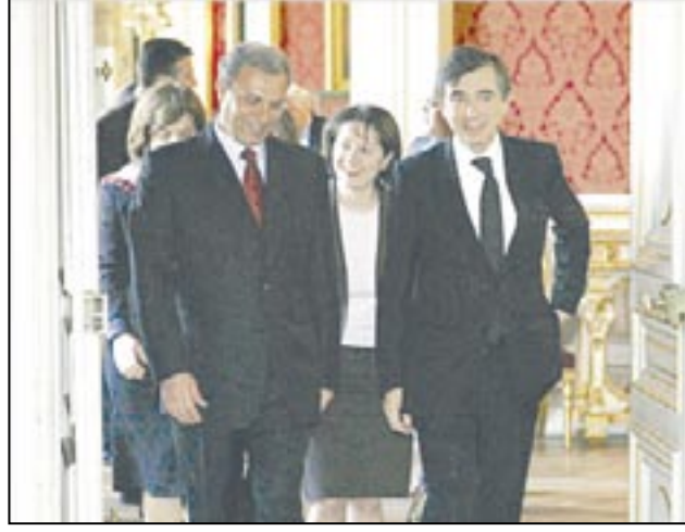
واعتبر وزير الإعلام الفلسطيني في بيان له أن دعوة أولمرت إلى لقاء بينه وبين قادة المقاومة السلمية للتهرب من استحقاقات السلام العادل من خلال طرح خطوات تطبيقية مع الدول العربية دون حل القضية الفلسطينية وقلبية حقوق الشعب الفلسطيني في المبادرة العربية.

فلسطين المحتلة/عواصم/وكالات: التقى وزير الخارجية الفلسطيني زيد أبو عمرو أمس في باريس نظيره الفرنسي فيليب دوست بلازي، كما أجرى وزير الإعلام الفلسطيني مصطفى البرغوثي محادثات في روما مع وزير الخارجية الإيطالي ماسيمو داليما في إطار جهود لحشد الدعم للحكومة الواحدة الوطنية واستئناف المحادثات الأوروبية المالية لها. وأعرب أبو عمرو عن أمل حكومته في الحصول على دعم سياسي ومالي من الاتحاد الأوروبي. واعتبر في حديث مع صحيفة لوموند قبل لقائه نظيره الفرنسي أن الحكومة الفلسطينية استجابت بالكامل تقريباً لشروط المجتمع الدولي. وطالب الوزير الفلسطيني بالتفريق بين الحكومة وحركة المقاومة الإسلامية (حماس) التي قال إن جزء من الحكومة يمثلها مثل حركة التحرير الفلسطيني (فتح) وباقي الفصائل والمستقلين. وسيتلقى أبو عمرو غداً رئيس الوزراء الفرنسي دومينيك دوفليان. وتأتي زيارة أبو عمرو لباريس ضمن جولة أوروبية ينتظر أن تشمل أيضاً النمسا وفرنسا ومقر الاتحاد الأوروبي في بروكسل. وتتوالى جهود إحياء عملية السلام، كما تتضمن سيل استئناف المساعدات للحكومة الفلسطينية. وفي روما قال مصطفى البرغوثي إنه دعا خلال لقائه وزير الخارجية إيطاليا والاتحاد الأوروبي إلى التعامل الكامل والقوي مع الحكومة الفلسطينية وعدم التمييز بين وزرائها. وأشار إلى أن داليما أكد نظريته الإيجابية لتشكيل حكومة وحدة فلسطينية ودعمه تطبيق اتفاق مكة، وأنه وعد بأن تعمل إيطاليا مع الأطراف الأوروبية كافة للتوصل إلى "موقف مرن وإيجابي" تجاه التعامل مع الحكومة الفلسطينية. وفي التطورات السياسية تواترت ردود الأفعال الفلسطينية