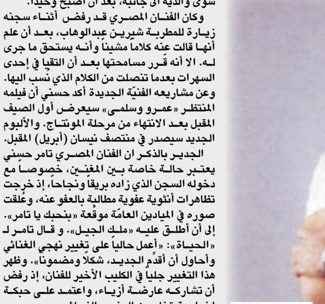
الفنان تامر حسني

□ القاهرة / متابعات: أشار ظهور مقدمة انشادية لبرنامج ديني يقدمه الداعية الاسلامي عمرو خالد في إحدى القنوات الفضائية العربية إشاعات تشير إلى أن تامر حسني يصدد اعتزال الفن تحت تأثير علاقته المستجدة بالداعية عمرو خالد الذي نصح تامر حسني بأن يكون قدوة للشباب بحسب تصريحات صحفية أدلى بها تامر حسني تعليقا على ما يتم تسريبه حول أبعاد التشديد الديني الذي قدم به برنامج الداعية عمرو خالد !! وأوضح حسني أنه لن يغير مساره الفني صوب الديني، بل سيواصل على توظيف صوته في أغان مفيدة وهادفة قدر الإمكان. ولم ينكر حسني أن هذا التحول سيعرضه لكثير من الانتقادات والهجوم من بعض الوسائل الاعلامية، مشيراً إلى أنه لن يتخلى عن تقديم الأغاني العاطفية الرومانسية وهو اللون الذي اشتهر به. وأفاد حسني أن تجربة سجنه غيرت الكثير من مفاهيمه وجعلته يرى الأمور في شكل أوضح. خصوصاً أن أقرب أصدقائه تخلوا عنه وقالوا فيه كلاماً غير لائق، ولم يجد حسني في محنته الأخيرة