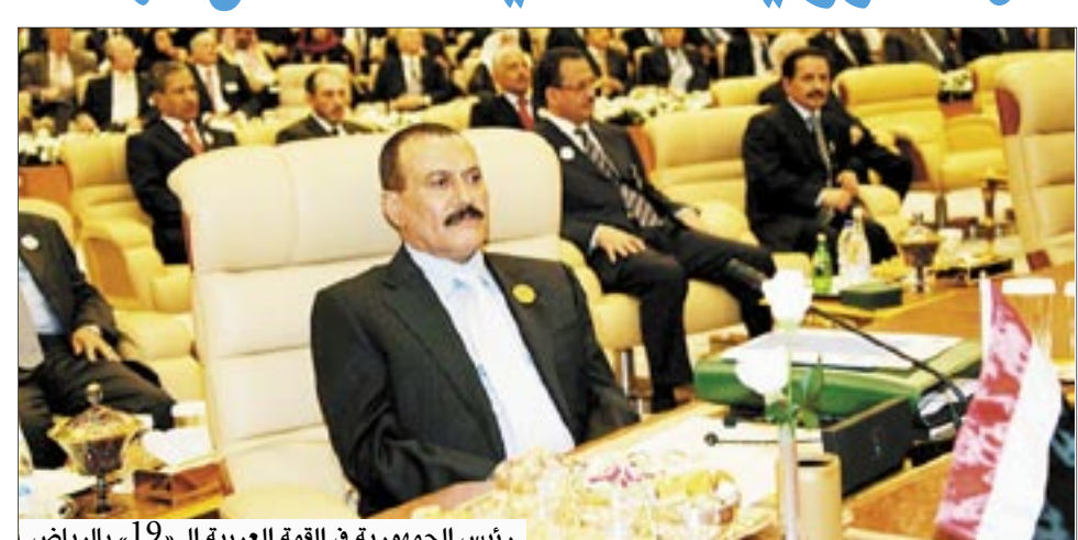
رئيس الجمهورية في القمة العربية الـ 19 بالرياض

□ الرياض/نجيب مقبل/ سبأ: يختتم الزعماء والقادة العرب اليوم في مركز الملك عبدالعزيز الدولي للمؤتمرات بالرياض أعمال قمتهم التاسعة عشرة بإصدار البيان الختامي. وكان فخامة الأخ الرئيس علي عبدالله صالح رئيس الجمهورية قد رأس جانباً من الجلسة المغلقة التي عقدت مساء أمس للقادة العرب المشاركين في القمة العادية التاسعة عشرة. وخلال الجلسة قدم الأخ رئيس الجمهورية العديد من المداخلات إزاء القضايا والمناقشات التي دارت في الجلسة المغلقة، حيث أكد الأخ الرئيس ضرورة التمسك بالمبادرة العربية التي أقرت في قمة بيروت عام 2002م ودون إجراء أي تعديل فيها أو التراجع عن أي بند من بنودها. وقال: إن إسرائيل تزداد يوماً تتهافتاً ورفضها للسلام، وهي لا تحتاج لأي تسويق لهذه المبادرة، وسبق وأن رفضت تلك المبادرة عندما تم الإعلان عنها في عام 2002م وقابلتها باقتحام جنين ومحاصرة الزعيم الفلسطيني الراحل ياسر عرفات. وأكد الأخ الرئيس ضرورة إدانة الإرهاب بكافة أشكاله وصوره ومن أي جهة أو طائفة جاء كونه خطراً يهدد دول المنطقة وأمن الجميع. (التتمة ص 2)