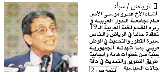
أمن عام الجامعة العربية

□ الرياض / سبأ: أشاد الأخ عمرو موسى الأمين العام لجامعة الدول العربية في تقريره المقدم للقمة العربية الـ 19 المتعددة حالياً في الرياض والخاص بمسيرة التطور والتحديث في الوطن العربي بما شهدته الجمهورية اليمنية من خطوات هامة وإيجابية في طريق التطوير والتحديث في كافة المجالات السياسية (التتمة ص 2)