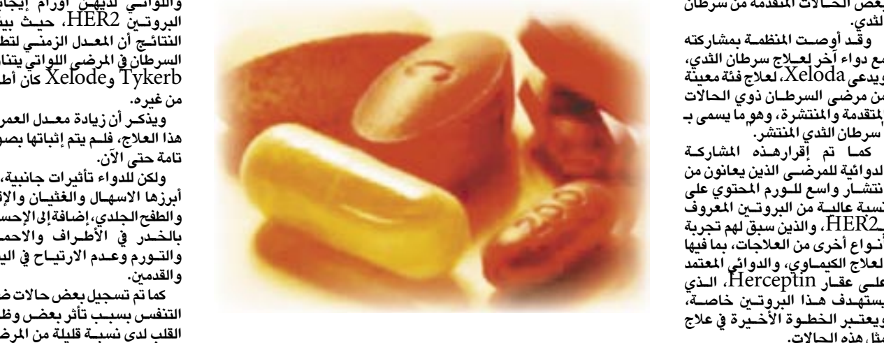
بعض الأدوية الفعالة والمنقوذة اعتباراً من نهاية شهر آذار/ مارس الحثاي، حسب ما أفادت به شركة

الإمام في توفير علاج جديد للرمضى الذين يعانون من تدهور في حالتهم الصحية بعد علاج السرطان لديهم الجرعة المقررة من الدواء الجديد هي حبة واحدة يومياً، حيث سيتم توفيره (الدواء) في الأسواق العالمية