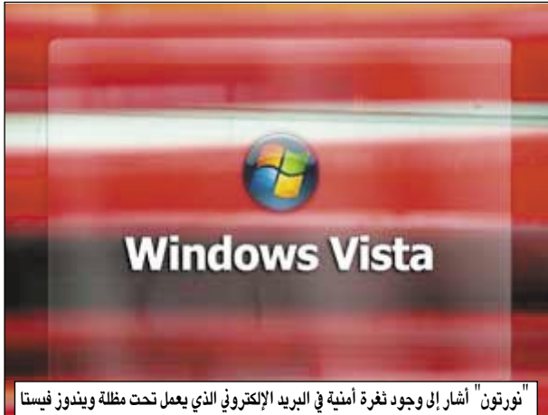
"نورتون" أشار إلى وجود ثغرة أمنية في البريد الإلكتروني الذي يعمل تحت مظلة ويندوز فيستا

أثير الكمبر عن وجود ثغرات أمنية في نظام التشغيل الجديد ويندوز فيستا التي طرحته شركة مايكروسوفت في بداية هذا العام، بيد أن شركة نورتون وهي أكبر شركة عالمية في مكافحة فيروسات الكمبيوتر جاءت بتقرير توفيره شريطاً جانبياً يقوم بعرض المعلومات. وأهم ما يميز هذا الإصدار هو ليس هذا وحسب وإنما تم تزويده بما يسمى Google Gad-gets المواقع التي يمكن من خلالها مشاهدة بريدك الإلكتروني، الطقس، الأسهم، الأخبار، الصور، وغيرها.