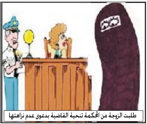
طلبت الزوجة من المحكمة تنحية القاضية بدعوى عدم نزاهتها