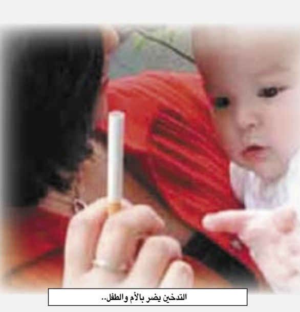
التدخين يضر بالأطفال...

أكد علماء أمريكيون أن مادة النيكوتين الموجودة في السجائر يمكن أن تحدد من قدرة الإنسان على التركيز. وأوضحت الباحثة ليزلي جاكوبسون من جامعة يال أن المدخنين المراهقين الذين كانت أمهاتهم تدخن أثناء الحمل يعانون من ضعف كبير في التركيز والقدرة على رؤية الأشياء أو سماع الآخرين بوضوح. وأكدت الباحثة أن قدرة الذكور والإناث على التركيز تتأثر بعوامل مختلفة، وأشارت إلى أن الفتيات اللاتي كانت أمهاتهن تدخن أثناء الحمل تراجع أدائهن المدرسي بشكل كبير مقارنة بغيرهن.