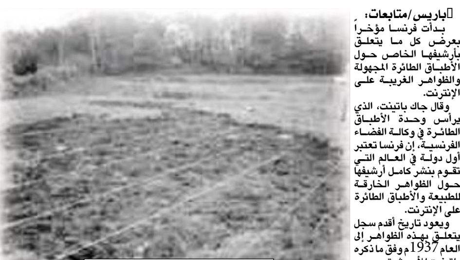
موقع فرنسا يقال إن طبقاً طائر أخط فيه

أطباق على الأرض وفي الحقول، بحسب ما ذكره بائنتن. وأشار المسؤول الفرنسي إلى أن العام 1954 زاد الاهتمام بهذه الظواهر، الأمر الذي دفع الجنرال شارل ديغول إلى تعيين مسؤول متابعة هذه المسألة. ومنذ ذلك العام، بلغ عدد التقارير المرفوعة حول مشاهدات غريبة ما بين 50 إلى 100 تقرير سنوياً، ولم يتم تفسير سوى 9 في المائة فقط من تلك الظواهر والحالات، فيما وجد العلماء أسباباً لنحو 33 في المائة من تلك الظواهر، بينما لم يتم تحديد ماهية 30 في المائة منها لنقص المعلومات.