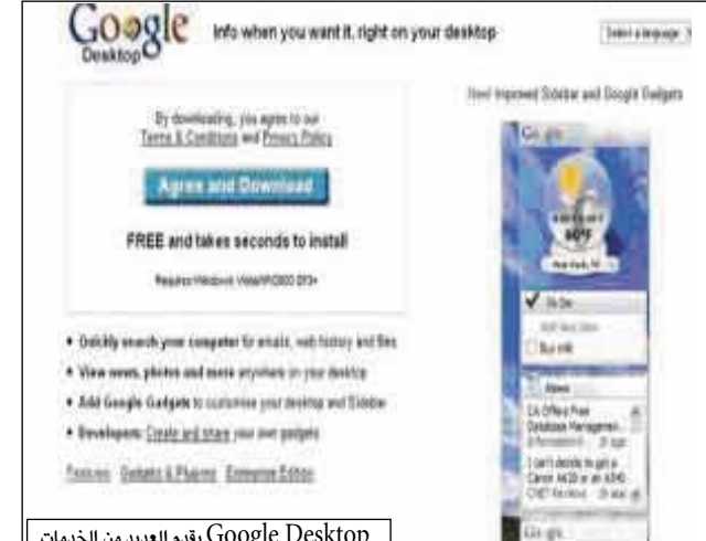
Google Desktop يقدم العديد من الخدمات

أطلقت جوجل الإصدار الخامس الجديد من خدمة Google Desktop الذي يشمل العديد من التحديثات سواء في الشريط الجانبي أو الأدوات أو الميزات. وأهم ما يميز هذا الإصدار هو البحث ضمن google desk- google top الذي يحذر المستخدم عن فتح رابط موقع يحتوي برامج خبيثة -Malware أو مواقع كاذبة.