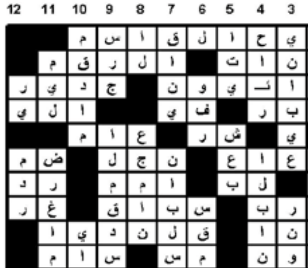
حل الحلقة رقم (121)