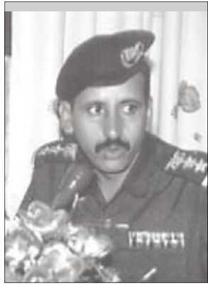
الاجراءات القانونية الراجعة بحق تلك الصحف، بما يؤمن الحد من التصادي على قانون الصحافة وكرامة الناس والشخصيات الاعتبارية.

السلطة القضائية. كما أوضح / قيران أن مهام أجهزة الأمن تتمثل في تنفيذ أحكام وقدرارات وأوامر وتوجيهات القضاء والنيابة المختصة في المحافظة، والمتعلقة بضبط وإشيعار واحضار المطلوبين قانوناً، وكذا التعامل مع البلاغات الجنائية وجمع الاستدالات وتحويلها إلى النيابة المختصة لتتخذ الإجراءات القانونية بشأنها.