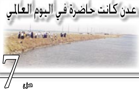
عدن كانت حاضرة في اليوم العالمي

● التحرر من الاستبداد والاستعمار ومخلفاتهما وإقامة حكم جمهوري عادل وإزالة الفوارق والامتيازات بين الطبقات. ● بناء جيش وطني قوي لحماية البلاد وحراسة الثورة ومكتسباتها. ● رفع مستوى الشعب اقتصاديا واجتماعيا وسياسيا وثقافيا. ● إنشاء مجتمع ديمقراطي تعاوني عادل مستمد أنظمتها من روح الإسلام الحنيف. ● العمل على تحقيق الوحدة الوطنية في نطاق الوحدة العربية الشاملة. ● احترام مواثيق الأمم المتحدة والمنظمات الدولية والتمسك بمبدأ الحياد الإيجابي وعدم الانحياز والعمل على إقرار السلام العالمي وتدعيم مبدأ التعايش السلمي بين الأمم.