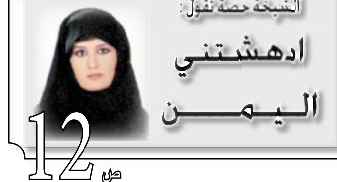
الشيخة حصة نفول: ادھشتني الیمن