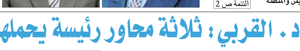
أكد الأخ الدكتور أبو بكر الغربي وزير الخارجية والمغتربين أن وفد اليمن إلى القمة العربية في الرياض برئاسة فخامة الأخ الرئيس / علي عبدالله صالح - رئيس الجمهورية سيحيط برؤية اليمن على القمة وأضاف الدكتور الغربي أن قمة الرياض ستناقش القضايا العربية الرئيسية وستوجه رسالة قوية بشأن التسليم بمبادرة السلام العربية نصا وروحا ورفض استيغاب أي عنصر من عناصرها مشيراً إلى وجود تطلع عربي لنجاح المملكة العربية الشقيقة بقائها ودورها في قيادة العمل العربي وحل أي خلافات بين الأشقاء .

صنعاء / 14 أكتوبر : أقادت مصادر مطبوعة أن فخامة الأخ الرئيس / علي عبدالله صالح - رئيس الجمهورية سيلتقي كي مون الأمين العام للأمم المتحدة وذلك على هامش القمة العربية في الرياض . وتوقعت المصادر أن يناقش فخامة الرئيس / علي عبدالله صالح مع أمين عام الأمم المتحدة العديد من القضايا المتعلقة بالتعاون بين اليمن والمنظمة ( التتمة ص 2 )