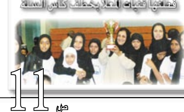
فطماها فتيات العنصرية كاس السلف