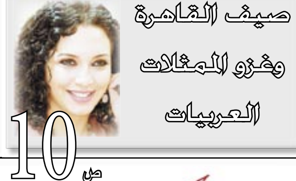
صيف العاصرية وهزمو المغتاللات العنصرية

● التحرر من الاستبداد والاستعمار ومخلفاتهما وإقامة حكم جمهوري عادل وإزالة الفوارق والامتيازات بين الطبقات. ● بناء جيش وطني قوي لحماية البلاد وحراسة الثورة ومكتسباتها. ● رفع مستوى الشعب اقتصاديا واجتماعيا وسياسيا وثقافيا. ● إنشاء مجتمع ديمقراطي تعاوني عادل مستمد أنظمتها من روح الإسلام الحنيف. ● العمل على تحقيق الوحدة الوطنية في نطاق الوحدة العربية الشاملة. ● احترام مواثيق الأمم المتحدة والمنظمات الدولية والتمسك بمبدأ الحياد الإيجابي وعدم الانحياز والعمل على إقرار السلام العالمي وتدعيم مبدأ التعايش السلمي بين الأمم.