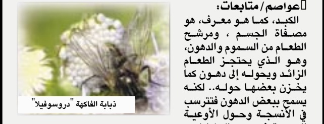
ذبابة الفاكهة "دروسوفيل"

دقيق لما يشكوه كل مريض، مع بيانات اجتماع مميزة كملته ومكان السكن وسن المريض. أصدرت جامعة واشنطن كتاب الجامع الكبير، ضمن مؤلفات الرازي، ويضيف كل منهما أن هذه الموسوعة العلمية تتكون من اثني عشر جزءاً، إلا أنها لا يتفقا في بيانها لغايات هذه الأجزاء، ثم يخطئان في تعريفها "الجامع الكبير" بأنه كتاب الجاهلي.