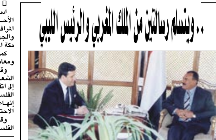
الرئيس لدى استقباله مستشار الملك المغربي

صنعاء / سبأ : أكد الأخ / محمد معتصم مستشار جلالته الملك / محمد السادس ملك المملكة المغربية الذي وصل أمس إلى صنعاء حاصل رسالة من الملك المغربي ، إن الرسالة تهدف إلى التشاور إزاء الحكم الذاتي للصحراء المغربية والاستماع إلى نصائح فخامة الأخ / علي عبدالله صالح / رئيس الجمهورية فيما يتعلق بذلك ، وذلك انطلاقاً من حرصه الشديد على دعم القضايا القومية بما يطمح شمل الأمة العربية وينبذ تجزئتها .