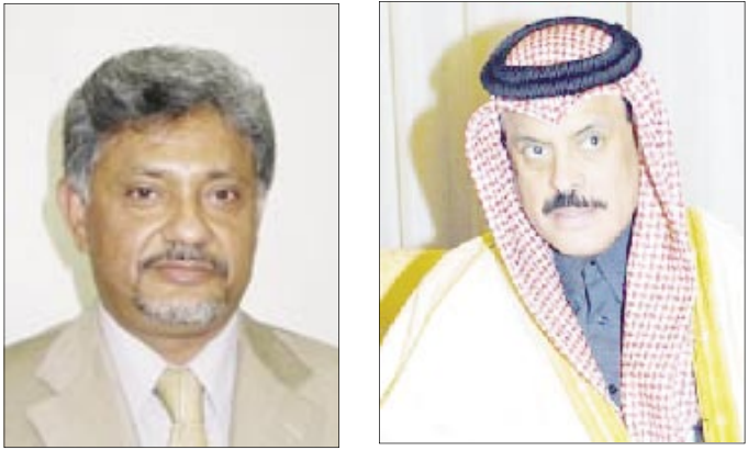
وزير الصناعة العطية

التعاون والجمهورية اليمنية .. الواقع والطموح، قوانين وأنظمة الاستثمار في دول المجلس والجمهورية اليمنية، وواقع البنى التحتية في مواقع الاستثمار والجوانب التنموية والتجارية ذات العلاقة بالقطاعات المختلفة، وفرص الاستثمار في المشروعات المتاحة في الجمهورية اليمنية، بالإضافة الى استعراض تجارب المشاريع المشتركة القائمة بين الجمهورية اليمنية ودول مجلس التعاون الخليجي، وكذا الإصلاحات الاقتصادية في الجمهورية اليمنية انعكاساتها على البيئة الاستثمارية. ويأتي عقد مؤتمر استكشاف فرص الاستثمار في إطار تعزيز العلاقات المتينة التي تربط دول مجلس التعاون الخليجي بالجمهورية اليمنية، ودفعها إلى مجالات أرحب وأكثر تقدما مع إعطاء الأولوية للمجالات الاقتصادية وتمشيا مع الجهود التي تقوم بها الحكومة اليمنية لتهيئة البيئة الاستثمارية الجيدة والمناسبة لجذب الاستثمارات الخليجية والأجنبية إليها. يذكر أن الفرص الاستثمارية التي ستعرض أمام المستثمرين ورجال الأعمال في المؤتمر وصلت إلى 100 فرصة استثمارية هي فرص كبيرة في المجالات الصناعية والتجارية والصناعية والسياحية، وقد وجهت الدعوات لأكثر من 1000 شركة استثمارية واقتصادية ورجال أعمال وشخصيات هامة للمشاركة في المؤتمر.