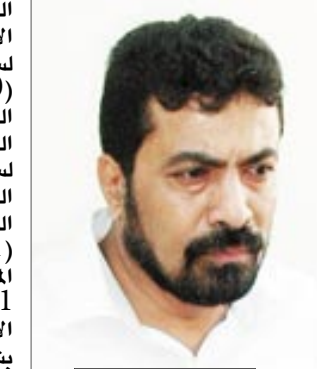
د. عدنان الجفري

□ صنعاء / سبأ : أكد الدكتور عدنان عمر الجفري وزير الشؤون القانونية أن التعديلات التي اقراها مجلس الوزراء في اجتماعه الأسبوعي الثلاثاء الماضي فيما يخص القوانين المتعلقة بالمرأة تهدف الى تعزيز حقوق المرأة وصورون كرامتها وعدم التقليل من شأنها باعتبار النساء شقائق الرجال ونصف المجتمع. وقال وزير الشؤون القانونية لوكالة الأنباء اليمنية (سبأ) إن التعديلات شملت 26 مادة، منها ساعت عمل المرأة في حالة الحمل وإصابة العمل والإجازات وسنن التقاعد واختصاص الشرطة النسائية ومدة إقامة الأجنبي المتزوج يمنيته وأولادها، والدعوى المتعلقة بالنفقة والحضانة وغيرها والموضوعات. وأوضح أن القوانين المعدلة تتضمن كلا من :