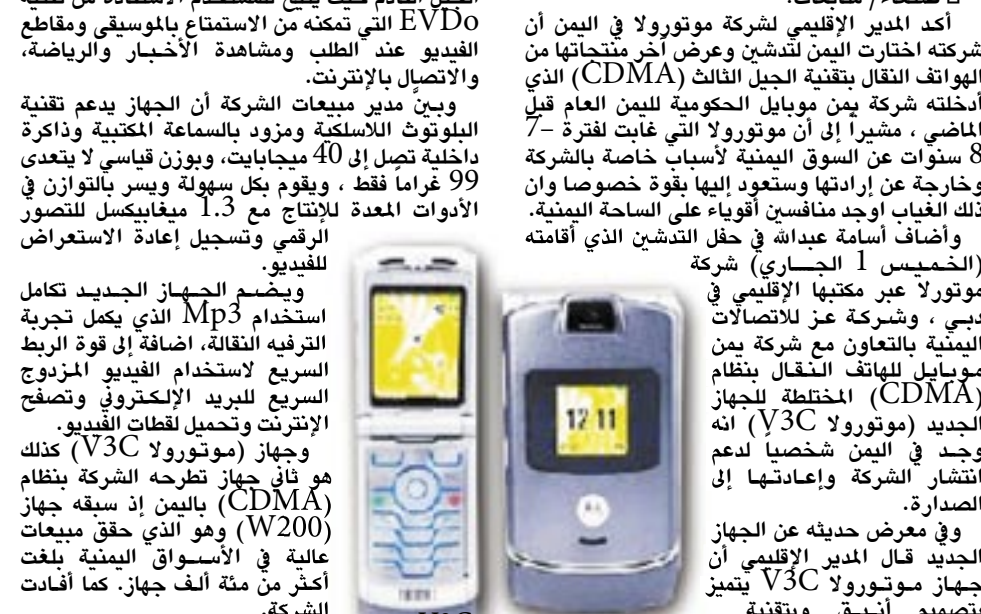
موتورولا الجديد V3C