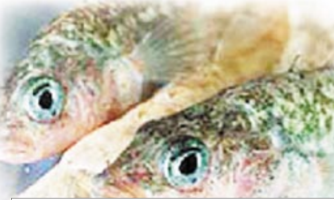
طول السمكة أكثر من متر لونها فضي ورمادي مع وجود نقط سوداء

□ أتبنا/ متابعات: حذر خبراء يونانيون من وجود نوع غريب من الأسماك السامة قد أتجه مؤخرا إلى شرق البحر المتوسط قادمة من موطنه الأصلي في غرب الباسفيك والمحيط الهندي. وأشار خبراء الأبحاث بمحطة روس للأحياء المائية، إلى أن الأسماك تحتوي على مادة سامة في كبدها وجلدها وأعضائها التناسلية، الأمر الذي يمكن أن يسبب شللا مميتا في العضلات ومشاكل في التنفس، والجهاز الدوري إذا تناولها الإنسان. وطبقا لما ورد بجريدة الدستور، أشار مدير المحطة إلى أن هذه الأسماك قد تسلت إلى شرق المتوسط عبر قناة السويس. يذكر أن طول السمكة يصل إلى أكثر من متر، وهي ذات لون فضي ورمادي مع وجود نقط سوداء وبطنها أبيض اللون بالإضافة إلى خط فضي فاتح. ووردت تقارير عن وفاة عشرة أشخاص بسبب تناولهم لهذا النوع من السمك في منطقة شرق البحر المتوسط، ثمانية منهم في مصر.