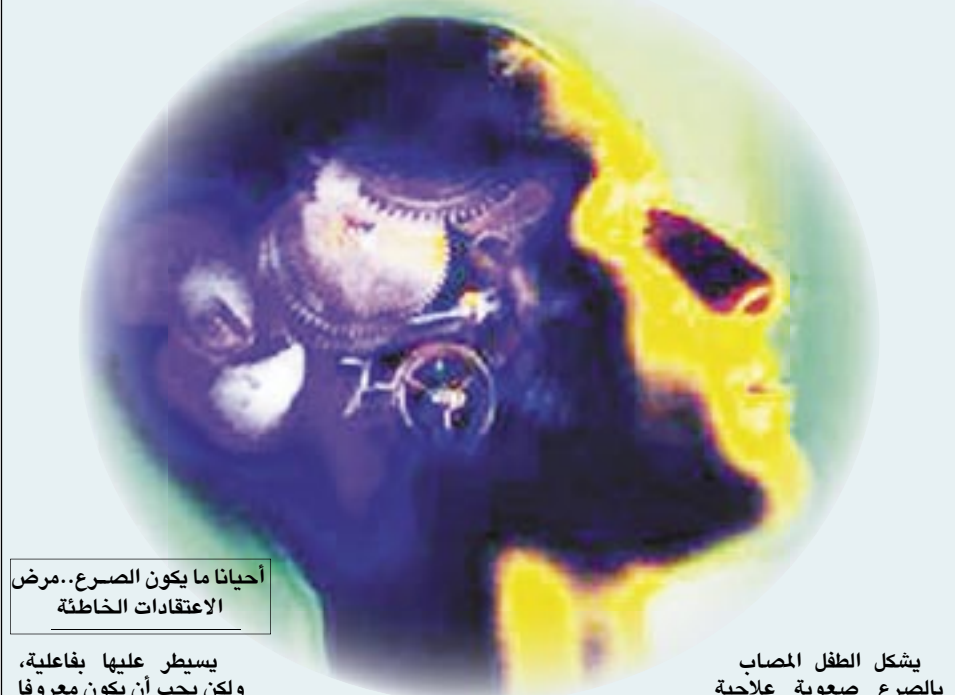
أحيانا ما يكون الصرع...مرض الاعتقادات الخاطئة

يسيطر عليها بفاعلية، ولكن يجب أن يكون معروفا أنه ليس كل الأطفال قابلين للاستجابة لهذا النوع من الغذاء، ولكن في بعض حالات الاستجابة الجيدة فإن الطبيب يمكن أن يقلل أو يسحب الدواء تدريجيا عن الطفل.