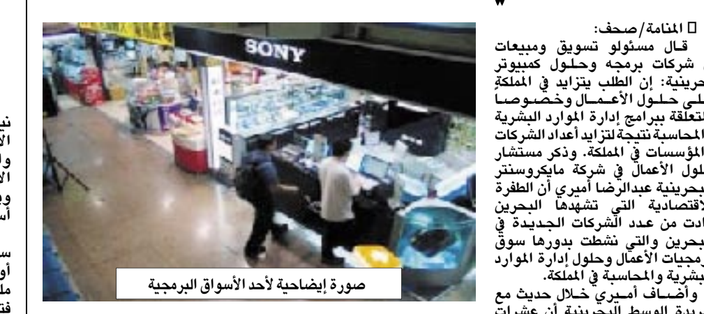
صورة إيضاحية لأحد الأسواق البرمجية

دون عرض تركيب هذه البرامج والنظم أو حتى إعطاء ضمانات عليه... ويشفي المسؤول الذي يعمل لأكثر من عشرة أعوام في مجال المعلوماتية: الشركات الصغيرة قد تفضل الحلول المحاسبية والإدارية الأرخص ثمناً وبعضها يتفاجأ أن هذه الحلول لا تلبى احتياجاتها أو لا تتوافق لها فنيوياً صيانة متخصصة لهذه الحلول ويلجأون إلى تغييرها بالتعاون مع شركات أخرى مما يكبد هذه الشركات خسائر تصل إلى نحو 15 ألف دينار لبعض الشركات المتوسطة.