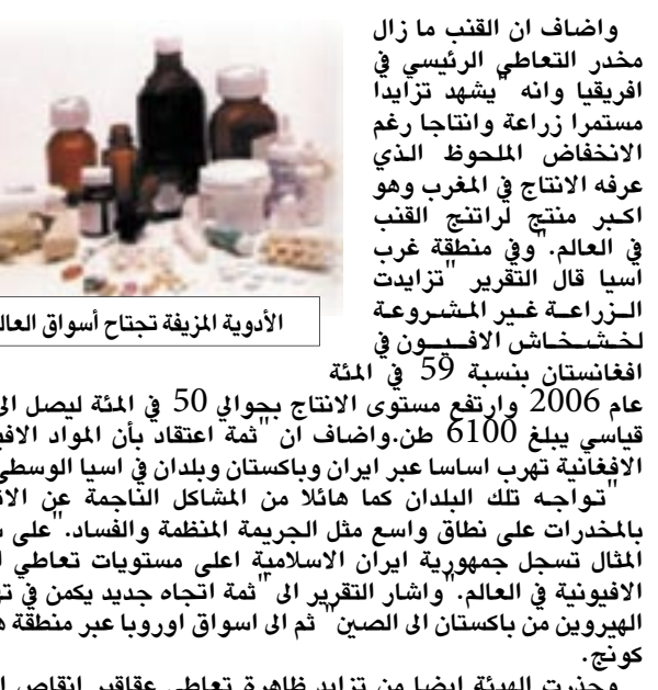
الأدوية المزيفة تجتاح أسواق العالم