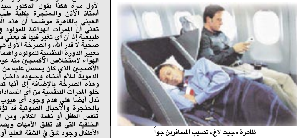
ظاهرة "جيت لاغ" تصيب المسافرين جواً