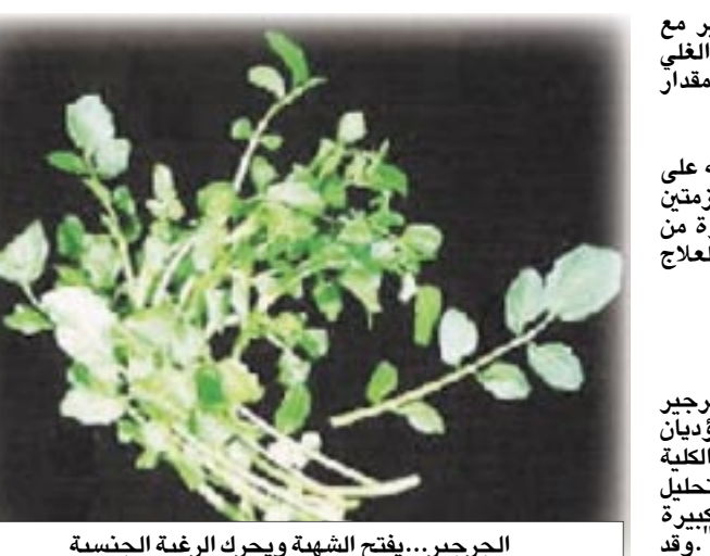
الجرجير... يفتح الشهية ويحرك الرغبة الجنسية