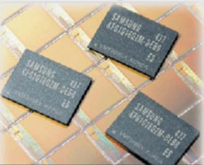
توفر OneNAND سرعة قراءة قصوى بمعدل 108 ميغا بايت / ثانية