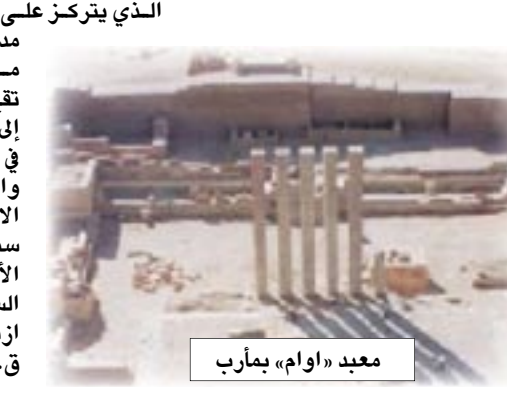
معبد «اوام» بمأرب

على ضوء ذلك إنزال مخطط المشروع المناقصة دولية سيعلن عنها قبل نهاية العام 2007م.. وقالت بيان المتحف سيتولى الى جانب العرض الأثري حفظ جميع القطع والمغورات الأثرية المكتشفة في المحافظة خلال السنوات الماضية. من جانب آخر أوضحت الدكتورة ايريس جريلاخ بأن الفريق الأثري التابع للمعهد الألماني للأثار اكتشف خلال نشاطه الأثري الذي يتركز على معهد المقبة وترجييمه في مدينة صروام جزءا كبيرا من سور المدينة ومقبرة تقع خارج السور وتشبه إلى حد ما المقبرة الموجودة في معبد «اوام» بمأرب.. وأضافت بيان الفريق الأثري العامل في صروام سبق له خلال أبحاثه الأثرية في هذه المدينة السبئية التي بلغت أوج ازدهارها في الألف الأول ق.م. اكتشاف مبنى سكني