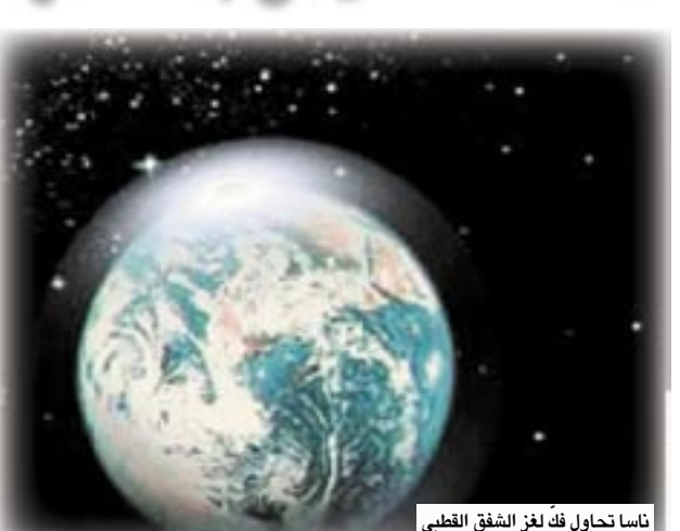
ناسا تحاول فك لغز الشفق القطبي

عرضه شرقاً وغرباً عدة آلاف من الكيلومترات في شكل ذيل. ويزداد حجمه كلما تقترب من الزمر الشعاعية ونور وري ويصبح عرضه عدة آلاف من الكيلومترات.