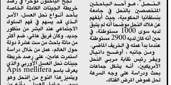
تصوير سلوك البشر عن طريق رصد جينات النحل