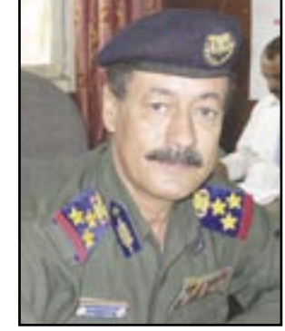
الحساسة والرئيسية والمناطق في اجهزة الامن عبر اقسامها في مختلف ارجاء المحافظات.

ولكننا لامل ان تحقق هذه الوحدات الوطنية يجسد العلاقة بين المواطن باعتبار امن المجتمع من الامور